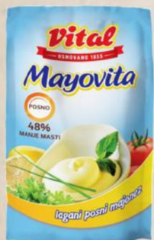
MAJONEZ LIGHT 180G