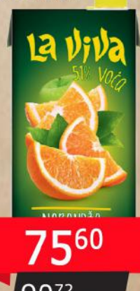
SOK 2L NARANDŽA