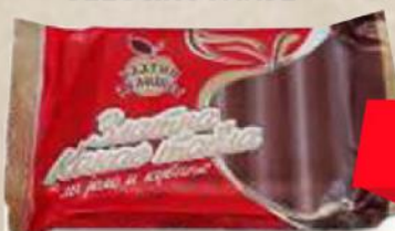
KAKAO TABLA 100G JELO&KUVANJE