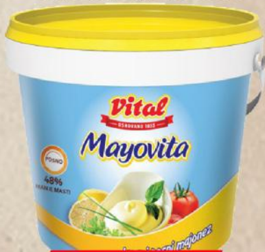
MAJONEZ LIGHT 900G