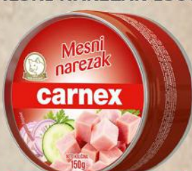
MESNI NAREZAK 150G