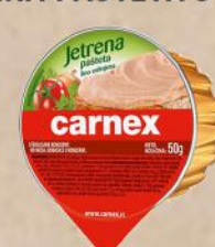
JETRENA PAŠTETA 50G