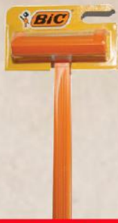
BIC 1 SENZITIV HANG.CARD BRIJAČ