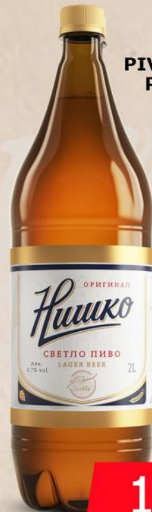
PIVO 2L PVC