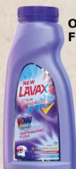
ODSTRANJIVAČ FLEKA 500ML