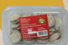
ZLATNA VANILICA 250G