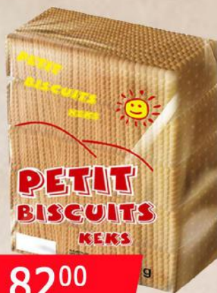
KEKS PETIT BISCUITS 700G