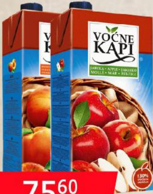
SOK 2L JABUKA/BRESKVA