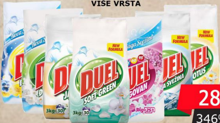
DETERDŽENT ZA VEŠ 3KG VIŠE VRSTA