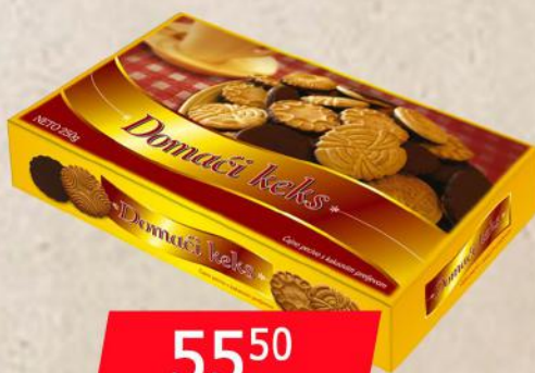
DOMAĆI KEKS 250G