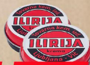
KREMA ZA CIPELE 30ML BRAON/CRNA