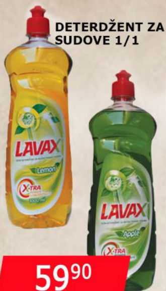
DETERDŽENT ZA SUDOVE 1/1