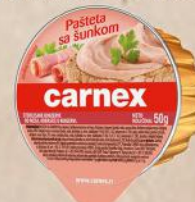
PAŠTETA SA ŠUNKOM 50G