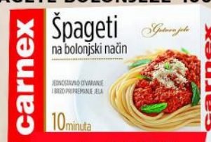
ŠPAGETE BOLONJEZE 400G