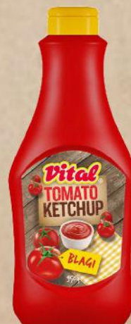
KEČAP BLAGI 950G