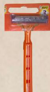
BIC 3 SEČIVA SENZITIV HC