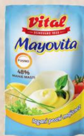
MAJONEZ LIGHT 90G