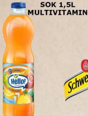
SOK 1,5L MULTIVITAMIN