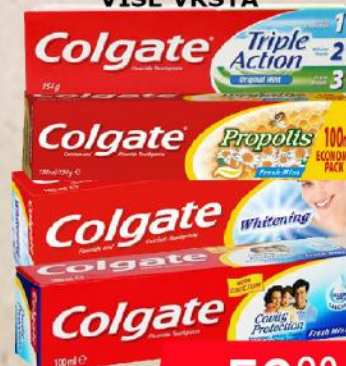
PASTA ZA ZUBE 100ML VIŠE VRSTA