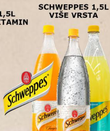
SCHWEPES 1,5L VIŠE VRSTA