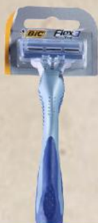
BIC COMFORT 3 FLEX HC