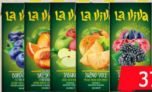
SOK 1L VIŠE VRSTA