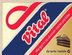
MARGARIN 250G UKUS SLATKE PAVLAKE