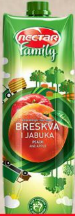
SOK 1L BRESKVA