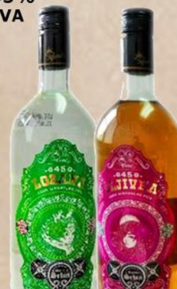
PROREX RAKIJA 1L 45% LOZA/ŠLJIVA