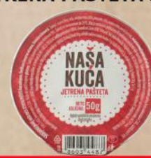
NAŠA KUĆA JETRENA PAŠTETA 50G