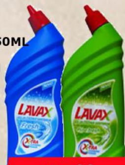
SANITAR 750ML CLASSIC PINE FRESH