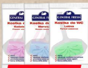
WC OSVEŽIVAČ 30G BOR/CVETNI/OKEAN