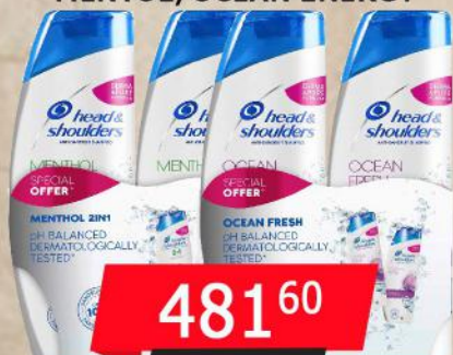
ŠAMPON H&S 2x360ML MENTOL/OCEAN ENERGY