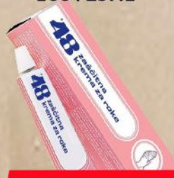
KREMA ZA RUKU 100+25ML