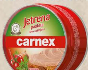
JETRENA PAŠTETA 150G