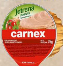
JETRENA PAŠTETA 75G