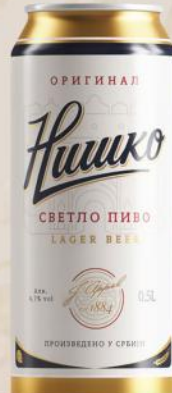
PIVO 0,5L LIMENKA