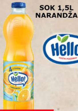
SOK 1,5L NARANDŽA