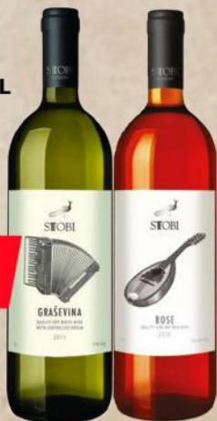
GRAŠEVINA 1L ROSE 1L