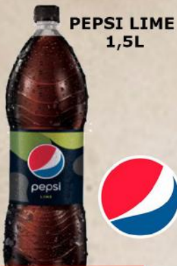
PEPSI LIME 1,5L