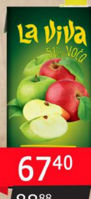
SOK 2L JABUKA