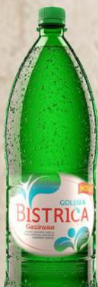
VODA GOLIJSKA BISTRICA 2L