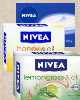
SAPUN KREM 100G