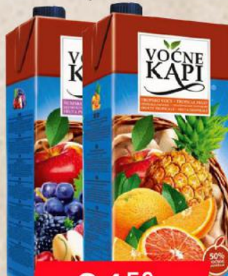
SOK 2L ŠUMSKO/TROPSKO VOĆE