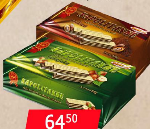
NAPOLITANKA 400G KAKAO/LEŠNIK