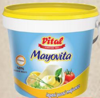
MAJONEZ LIGHT 450G