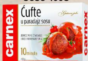
ĆUFTE U PARADAJZ SOSU 400G