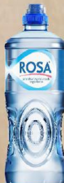
VODA 0,75L NEGAZIRANA