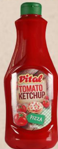
KEČAP PIZA 950G