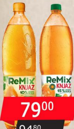
REMIX 1,5L KRUŠKA/NARANDŽA