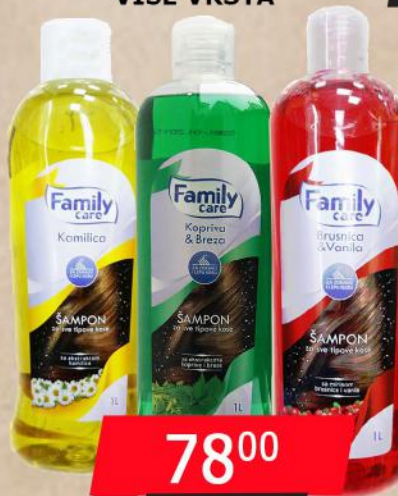
ŠAMPON 1L VIŠE VRSTA