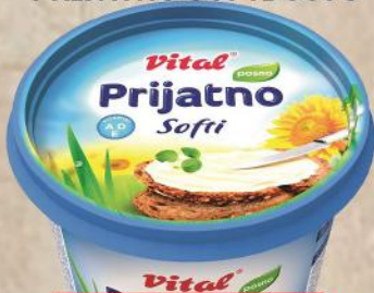
PRIJATNO SOFTI 500G