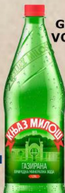
GAZIRANA VODA 1,25L