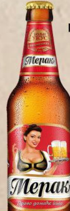
PIVO 0,5L FLAŠA