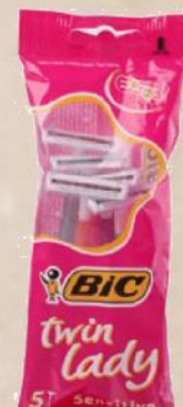
BIC TWIN LADY HC