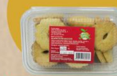
ČAJNI KOLUČIĆI 250G