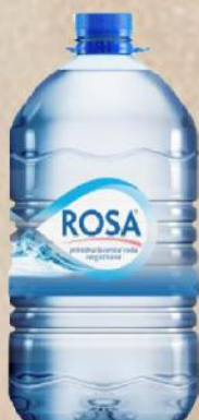
VODA 6L NEGAZIRANA