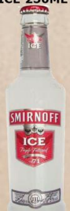
VODKA SMIRNOFF ICE 250ML