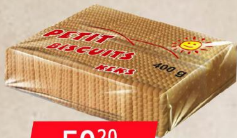
KEKS PETIT BISCUITS 400G