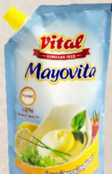
MAJONEZ LIGHT 270ML