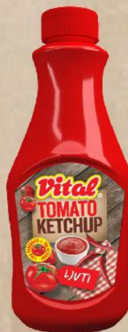
KEČAP LJUTI 950G