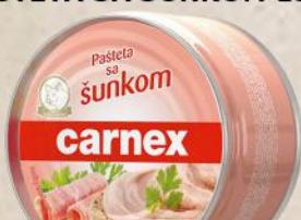
PAŠTETA SA ŠUNKOM 150G