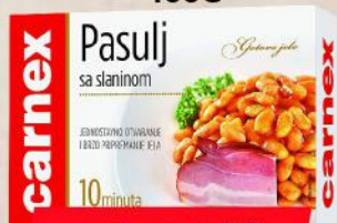
PASULJ SA SLANINOM 400G