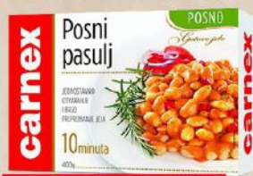
POSNI PASULJ 400G