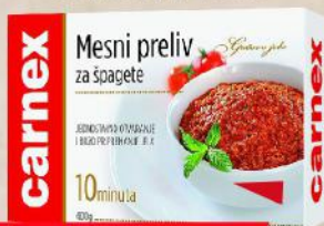
MESNI PRELIV ZA ŠPAGETE 400G