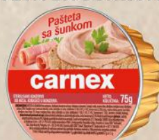
PAŠTETA SA ŠUNKOM 75G