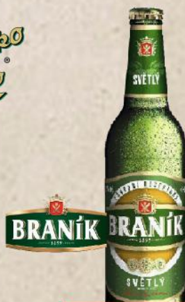
PIVO 0,5L FLAŠA