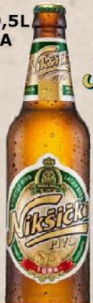
PIVO 0,5L FLAŠA