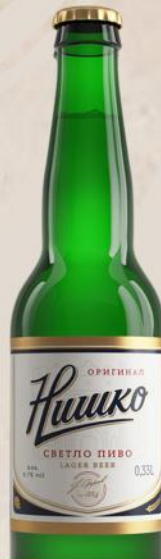
PIVO 0,33L STAKLO