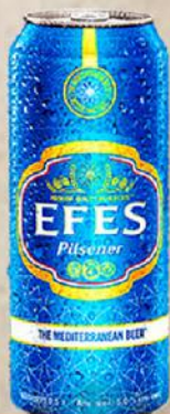
PIVO 0,5L LIMENKA