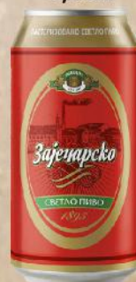
ZAJEČARKO PIVO 0,33L