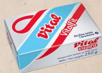
MARGARINKI NAMAZ VITALFIT 250G