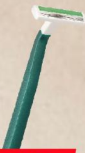
BIC 2 SEČIVA COMFORT TWIN HC