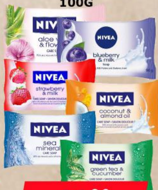
SAPUN KREM 100G