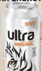
ULTRA ENERGY 0,5L