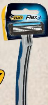
BIC FLEX 3 BRIJAČ