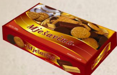
KEKS MEŠAVINA 300G