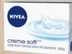
SAPUN KREM 100G