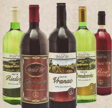
VINO 1L GECI M VIŠE VRSTA