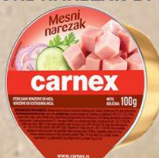
MESNI NAREZAK 100G