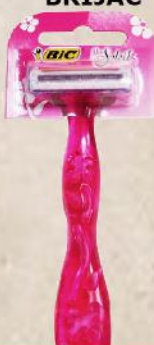
BIC MISS SOLEIL BRIJAČ