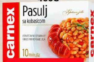
PASULJ SA KOBASICOM 400G