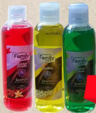
ŠAMPON 500ML VIŠE VRSTA