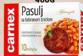
PASULJ SA FAŠ.ŠNICLOM 400G