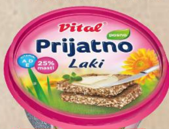
PRIJATNO LAKI 255G