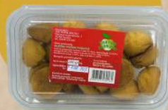
VOĆNA PUSLICA 200G