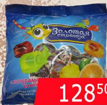
KDV GUMENE BOMBONE 500G