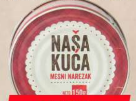
NAŠA KUĆA MESNI NAREZAK 150G