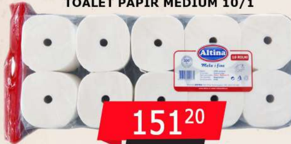
TOALET PAPIR MEDIUM 10/1