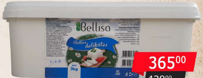
SIR DELIKATES BELLISA 3KG