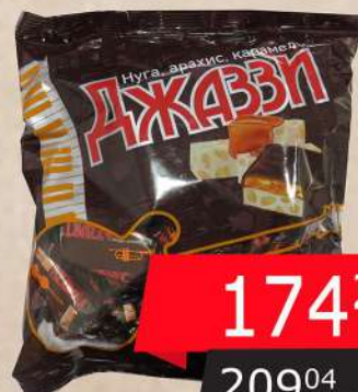
KDV BOMBONE DJAZZI KIKIRIKI 500G