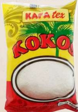
KOKOS BRAŠNO 100G