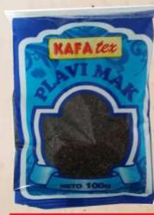
PLAVI MAK 100G