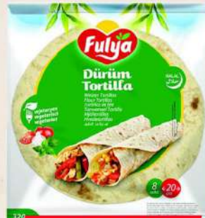
FULYA TORTILJA 8KOM/20CM 320G