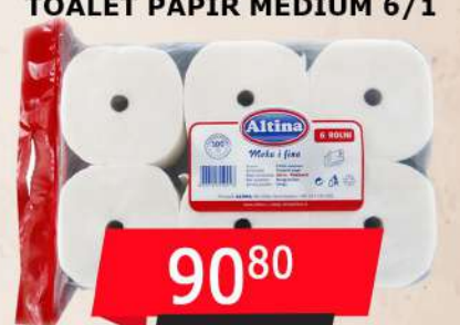
TOALET PAPIR MEDIUM 6/1