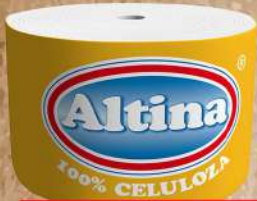
TOALET ROLNA 15CH0