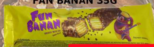
KDV ČOKO BAR FAN BANAN 35G