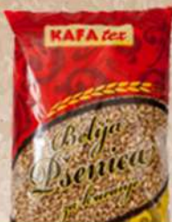
PŠENICA BELIJA 0,5KG