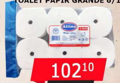
TOALET PAPIR GRANDE 6/1