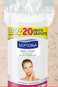
OVALNI TUFERI ZA LICE 40+20/1