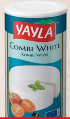
YAYLA FETA SIR 0,8KG