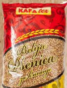
PŠENICA BELIJA 1KG