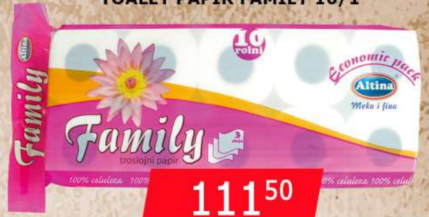
TOALET PAPIR FAMILY 10/1