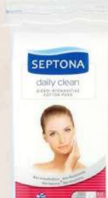
TUFERI ZA LICE ČETVRTASTI 50/1