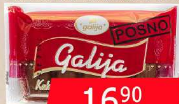
POSNA KREM TABLA ZA JELO I KUVANJE 100G