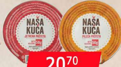
NAŠA KUĆA JETRENA/PILEĆA PAŠTETA 50G