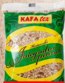
INTEGRALNI PIRINAČ 0,5KG