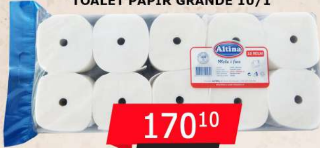
TOALET PAPIR GRANDE 10/1