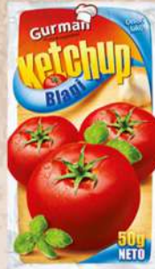
KEČAP BLAGI 50G