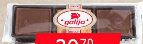
GALIJA CHOCO BISCUIT 125G