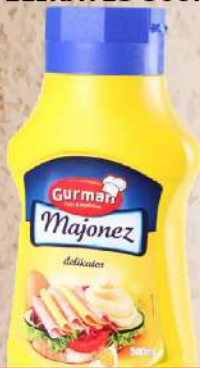
MAJONEZ DELIKATES 500ML