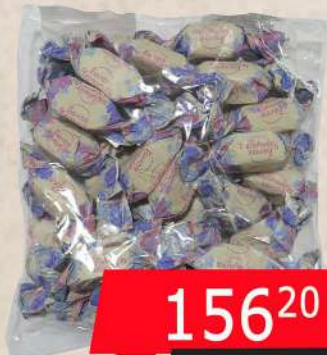
KDV BOMBONE BELA TREŠNJA 500G