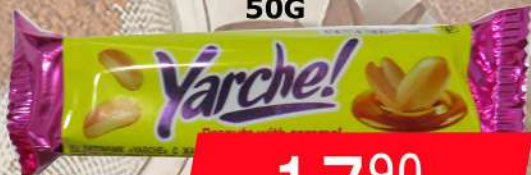
KDV ČOKO BAR JARCE- KIKIRIKI 50G