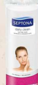
TUFERI ZA LICE OKRUGLI 80/1