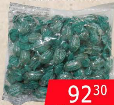
KDV BOMBONE UKUS NANE 500G