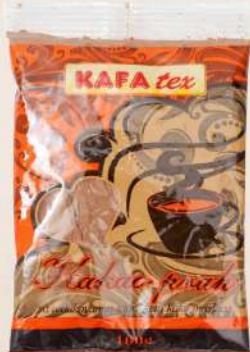
KAKAO PRAH 100G