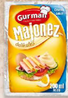
MAJONEZ DELIKATES 200ML