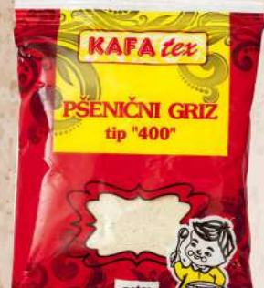
PŠENIČNI GRIZ 400G