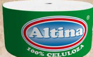
TOALET ROLNA 19CH0