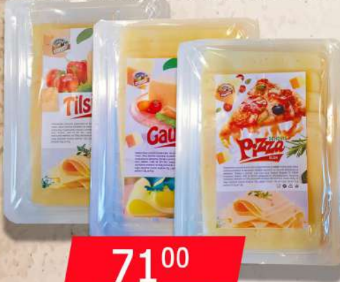
GAUDA/TILSINO/PIZZA SLAJS 100G