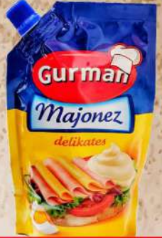
MAJONEZ DELIKATES 285ML