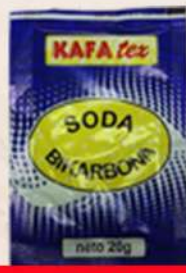
SODA BIKARBONA 20G