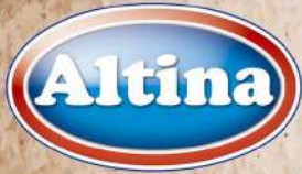
PAPIRNI UBRUS XXL