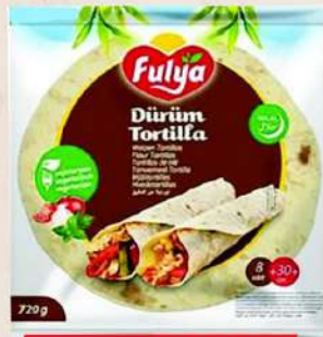
FULYA TORTILJA 8KOM/30CM 720G