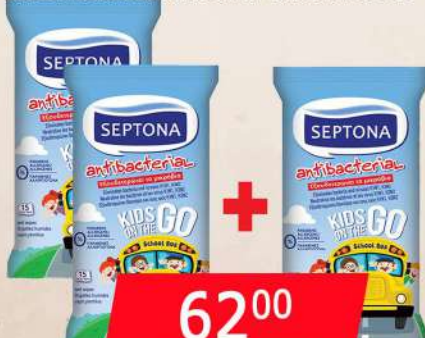
KIDS ON THE GO 15/1 2+1 ANTIBAKTERIJSKE MARAMICE