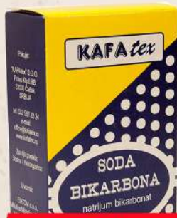
SODA BIKARBONA 400G