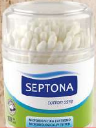
ŠTAPIĆI ZA UŠI 100/1