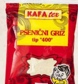
PŠENIČNI GRIZ 200G