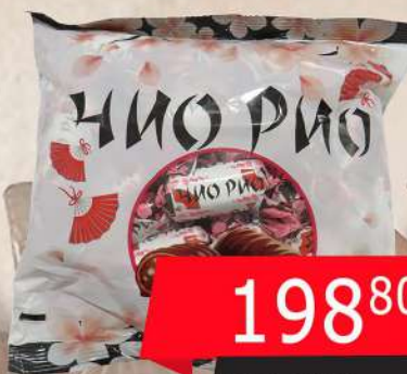
KDV BOMBONE ČIO RIO 500G