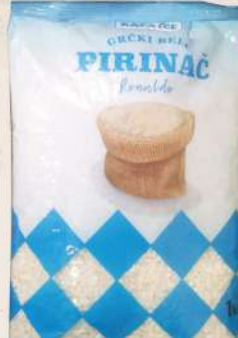
GRČKI PIRINAČ 1KG