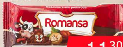
TROSLOJNA KREM TABLA 45G