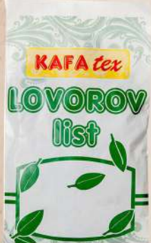
LOVOROV LIST 10G