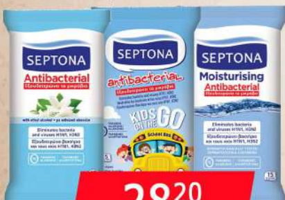
ANTIBAKT. MARAMICE 15/1 VIŠE VRSTA