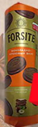
KDV KEKS FORSITE ČOKOLADA&LEŠNIK 208G