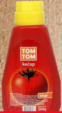
TOM TOM KEČAP BLAGI 500G