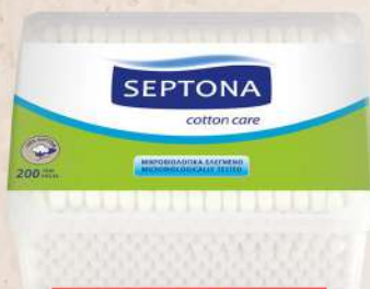
SEPTONA ŠTAPIĆI ZA UŠI 200/1