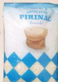
GRČKI PIRINAČ 0,5KG