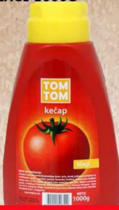
TOM TOM KEČAP BLAGI 1000G