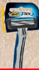
BIC FLEX 3 BRIJAČ