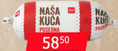
NAŠA KUĆA MINI POSEBNA 300G