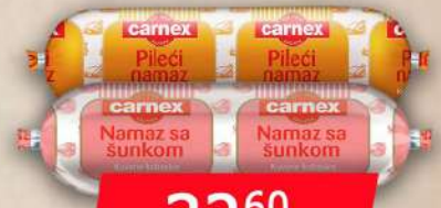
NAMAZ SA ŠUNKOM 120G NAMAZ PILEĆI 120G