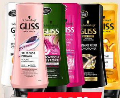
GLISS BALSAM 200ML