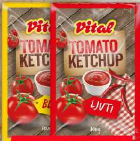
KEČAP 100G BLAGI / LJUTI