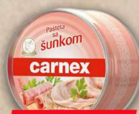
PAŠTETA SA ŠUNKOM 150G