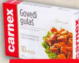
GOVEĐI GULAŠ 400G