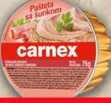
PAŠTETA SA ŠUNKOM 75G