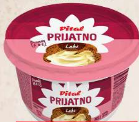
MARGARIN PRIJATNO LAKI 512G