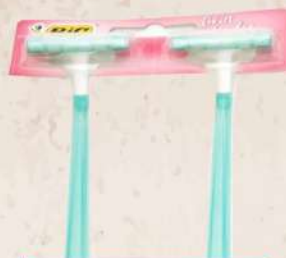
BIC TWIN LADY HC 24