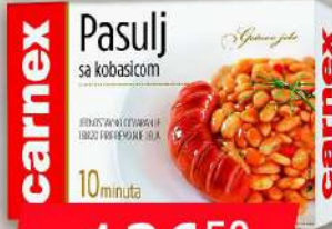
PASULJ SA KOBASICOM 400G