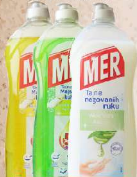
MER BALSAM 750ML VIŠE VRSTA