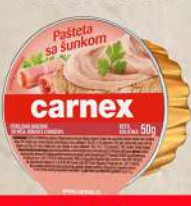
PAŠTETA SA ŠUNKOM 50G