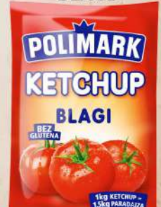
KEČAP 90G BLAGI