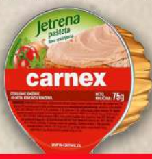
JETRENA PAŠTETA 75G