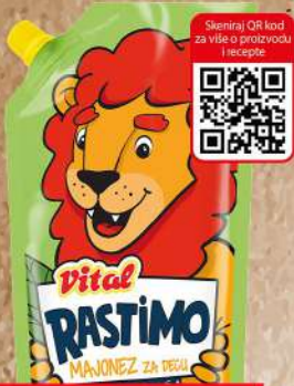
RASTIMO MAJONEZ 270G