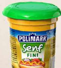
SENF 100G FINI