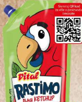
RASTIMO KEČAP BLAGI 270G