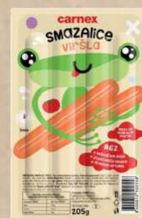
SMAZALICE VIRŠLA 205G