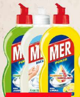
MER BALSAM 450ML VIŠE VRSTA