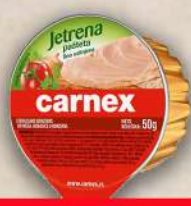
JETRENA PAŠTETA 50G