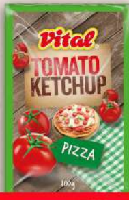
KEČAP 100G PIZZA