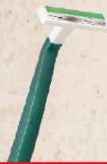
BIC 2 SEČIVA COMFORT TWIN HC