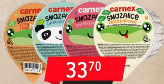
PAŠTETA SMAZALICA 50G