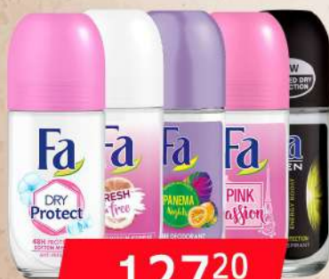
FA ROLL ON 50ML VIŠE VRSTA