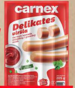
DELIKATES VIRŠLA 205G