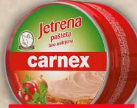
JETRENA PAŠTETA 150G