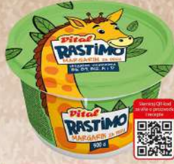
MARGARIN 500G RASTIMO