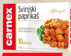
SVINJSKI PAPRIKAŠ 400G