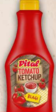
KEČAP BLAGI 450G