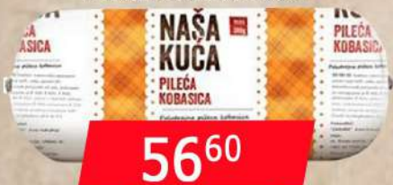
NAŠA KUĆA MINI PILEĆA 300G