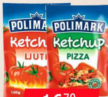
KEČAP 100G LJUTI/PIZZA