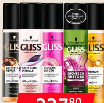
GLISS BALSAM SPRAY 200ML