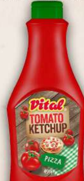
KEČAP PIZZA 450G