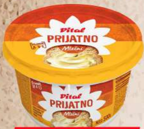
MARGARIN MLEČNI 500G