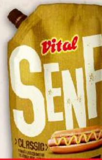
SENF CLASSIC 270G