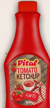
KEČAP LJUTI 450G