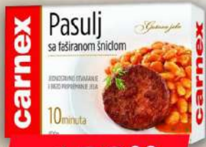
PASULJ SA FAŠ.ŠNICLOM 400G