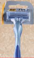
BIC COMFORT 3 FLEX HC