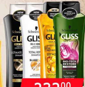
GLISS ŠAMPON 400ML VIŠE VRSTA