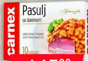
PASULJ SA SLANINOM 400G