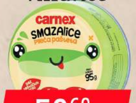
PAŠTETA SMAZALICA PILEĆA 95G