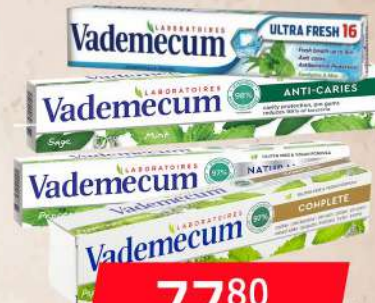
VADEMECUM 75ML PASTA ZA ZUBE