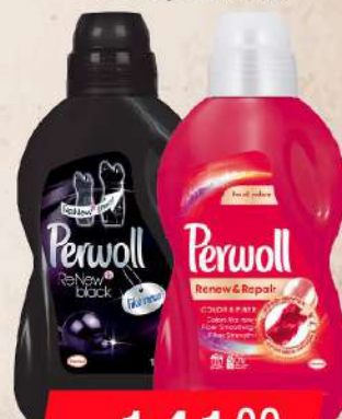
PERWOLL 1L CRNI/COLOR