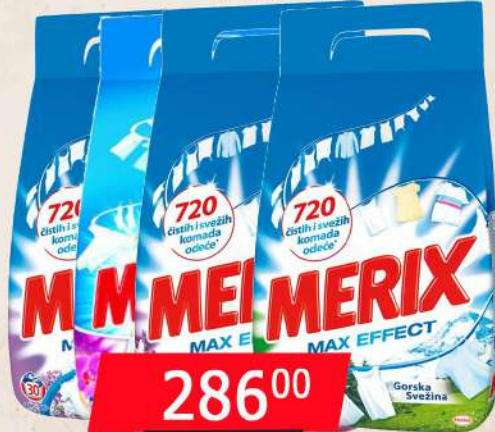
MERIX DETERDŽENT ZA VEŠ 3KG