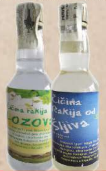
ČIČINA RAKIJA 0,1L PVC LOZOVAČA/ŠLJIVA