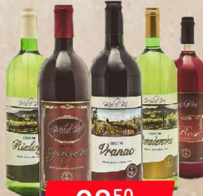
VINO GECI M 1L VIŠE VRSTA