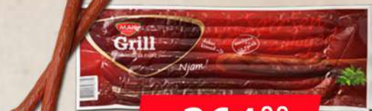
GRILL KOBASICA 1KG