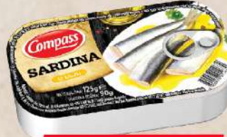
SARDINA U ULJU 125G