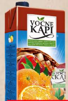
SOK 2L POMORANDŽA