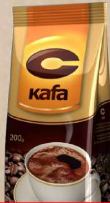
DONCAFE C KAFA 200G