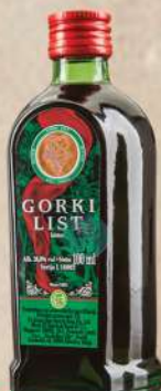
GORKI LIST 0,1L PELINKOVAC