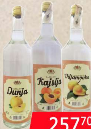
VICTORY DUNJA KAJSIJA/VILJAMOVKA 1L