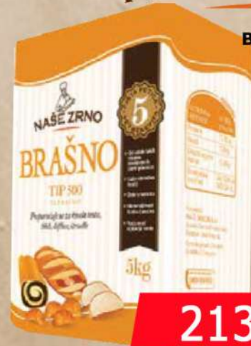
BRAŠNO T-500 5KG