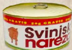
SVINJSKI NAREZAK 400G