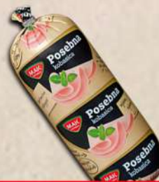
MINI POSEBNA 350G