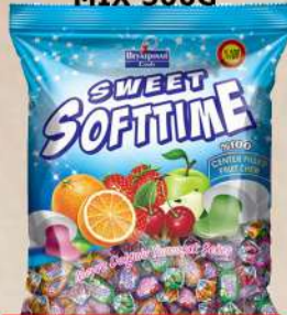
SOFTTIME BOMBONE MIX 500G