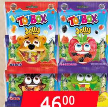
TOY BOX JELLY FRUIT MIX 80G