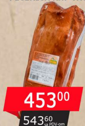
PANT DIM.SVINJSKA PEČENICA RNF VACUM