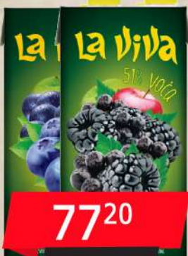
SOK 2L BOROVNICA&JABUKA&GROŽĐE, ARONIJA&KUPINA