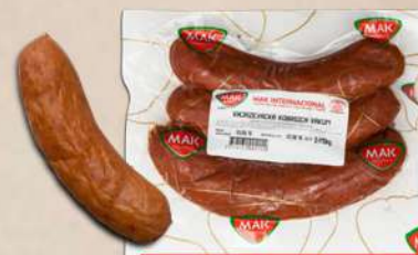
KNJAŽEVAČKA KOBASICA 1KG