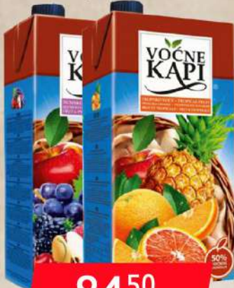
SOK 2L ŠUMSKO/TROPSKO VOĆE