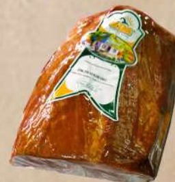
PANT DIM.SVINJSKI VRAT RNF VACUM