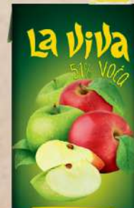
SOK 2L JABUKA