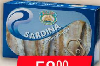
SARDINA U ULJU 125G