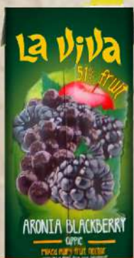
SOK 1L ARONIJA&KUPINA