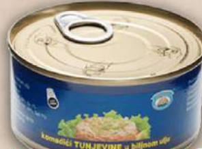
TUNJEVINA 170G SITNA