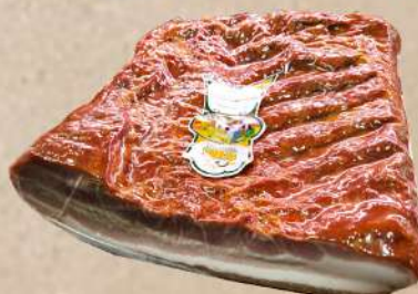
PANT DIM.SLANINA HAMBURKA RNF VACUM