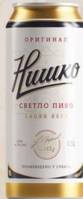
PIVO 0,5L LIMENKA