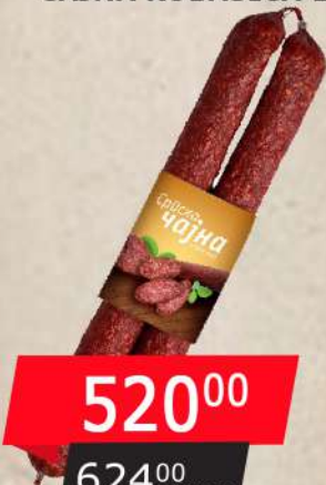
PETKOVIĆ SRPSKA ČAJNA KOBASICA 1KG