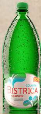
VODA GOLIJSKA BISTRICA 2L