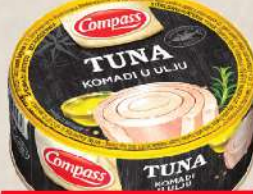
TUNA KOMADI U ULJU 160G