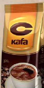
DONCAFE C KAFA 100G