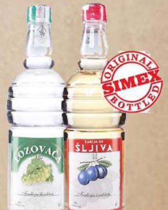
LOZOVAČA 45% PET 1L ŠLJIVOVICA 45% PET 1L