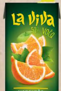
SOK 2L NARANDŽA