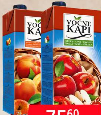
SOK 2L JABUKA/BRESVA