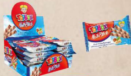
TOY BOX NUTI STICK 20G