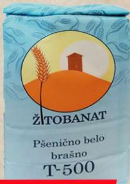
BRAŠNO T-500 1KG