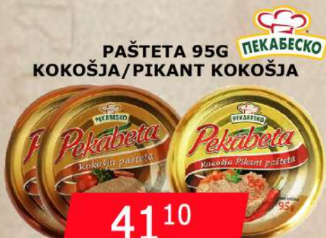
PAŠTETA 95G KOKOŠJA/PIKANT KOKOŠJA