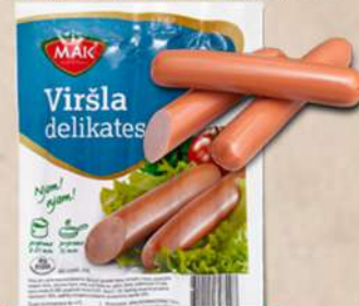
DELIKATES VIRŠLA 200G