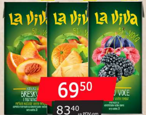
SOK 2L BRESKVA/JUŽNO VOĆE/ŠUMSKO VOĆE