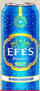
PIVO 0,5L LIMENKA