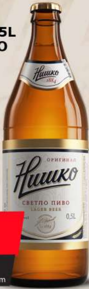
PIVO 0,5L STAKLO