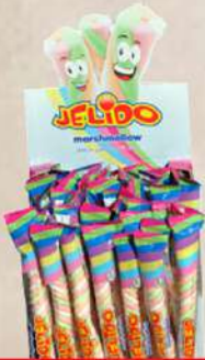
PENASTE BOMBONE 14G