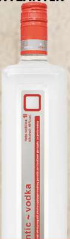
RUBIN VODKA 1L ANTLANTIK 40%