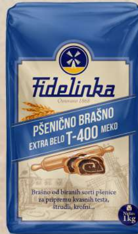
BRAŠNO MEKO T-400 1KG