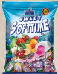
SOFTTIME BOMBONE MIX 90G