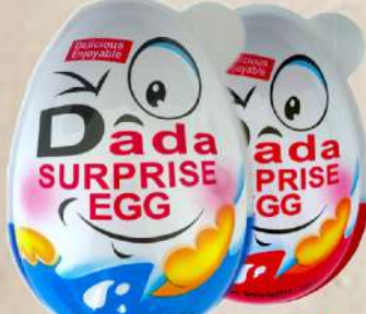
DADA SURPRICE EGG MEŠAVINA 8/1