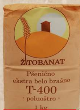
BRAŠNO T-400 1KG