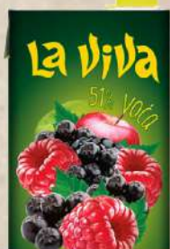
SOK 2L ARONIJA&MALINA