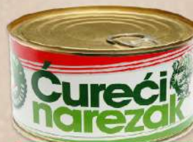
ĆUREĆI NAREZAK 400G