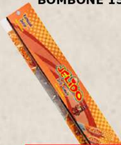
TRAKASTE KOLA BOMBONE 15G