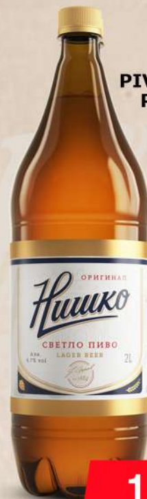
PIVO 2L PVC