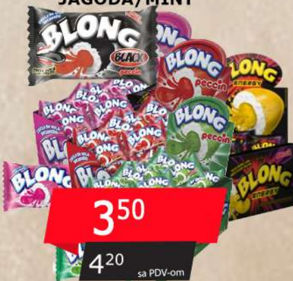
BLONG ŽVAKAČA GUMA 5G BLACK/ENERGY/ JAGODA/MINT