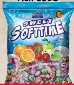
SOFTTIME BOMBONE MIX 350G