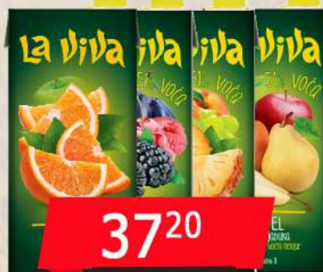
SOK 1L VIŠE VRSTA