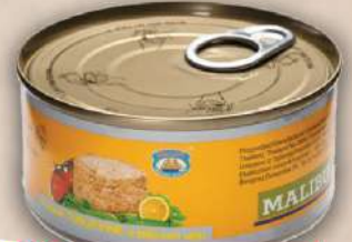
TUNJEVINA 170G KOMAD