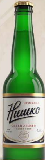
PIVO 0,33L STAKLO