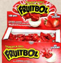
FRUITBOL JAGODA ŽVAKAČA GUMA 3.5G