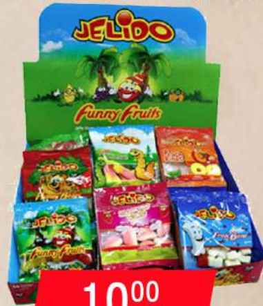
MIX GUMENE BOMBONE 15G