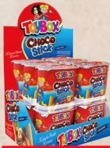
TOY BOX CHOCO STICK 56G