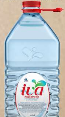
VODA 6L BALON