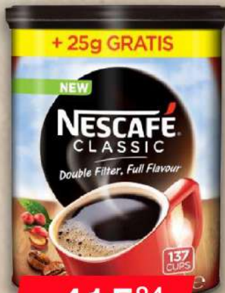
NESCAFÉ CLASSIC 250G+25G GRATIS