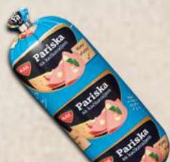
MINI PARISKA SA KAČKAVALJEM 350G