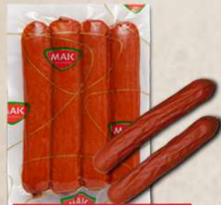
PIKANT KOBASICA 250G