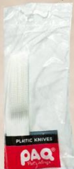
NOŽ PLASTIČNI BELI 20/1