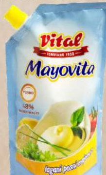
MAJONEZ LIGHT 270ML