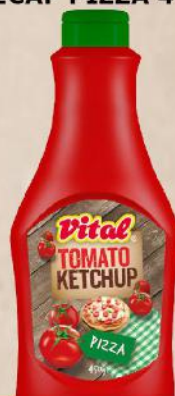
KEČAP PIZZA 450G