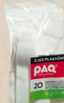
KAŠIKA PLASTIČNA BELA 20/1