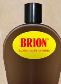
AL BRION LOSION BR2 78ML