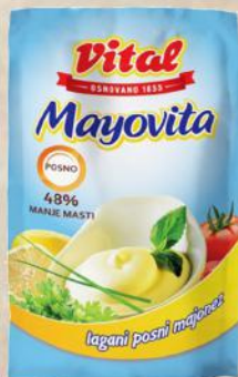
MAJONEZ LIGHT 180G