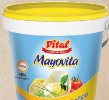
MAJONEZ LIGHT 900G