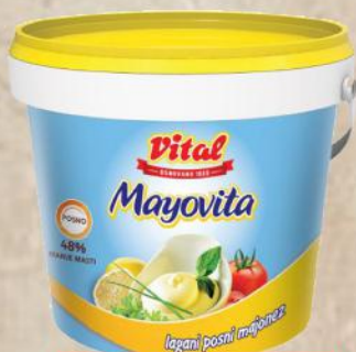
MAJONEZ LIGHT 450G