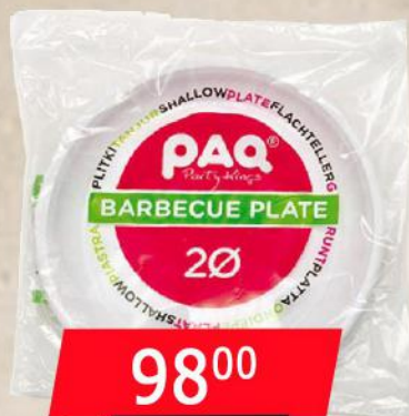
TANJIR PLASTIČNI PLITKI BELI 20/1