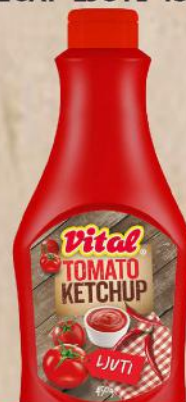
KEČAP LJUTI 450G