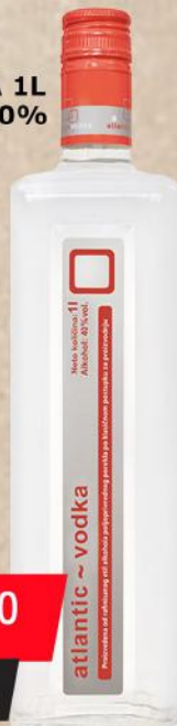
RUBIN VODKA 1L ANTLANTIK 40%