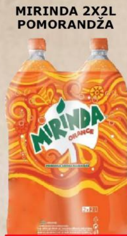
MIRINDA 2X2L POMORANDŽA