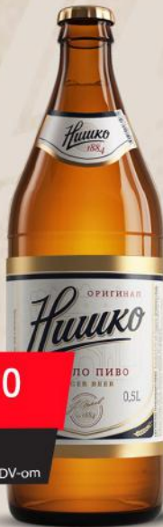
PIVO 0,5L STAKLO