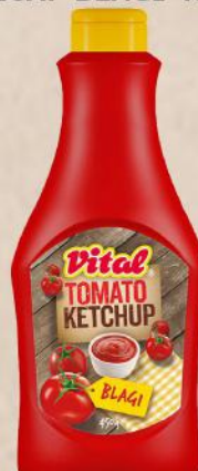
KEČAP BLAGI 450G