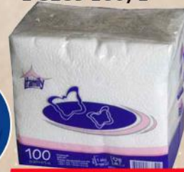
FAMILY SALVETA 1 SLOJ 100/1