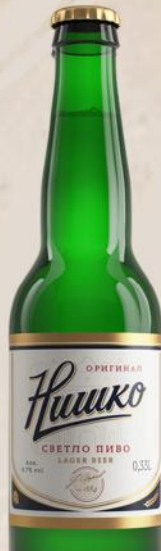
PIVO 0,33L STAKLO