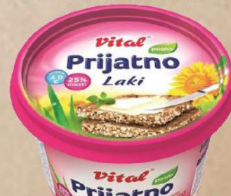
PRIJATNO LAKI 512G