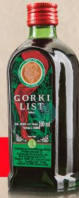
GORKI LIST 0,1L PELINKOVAC