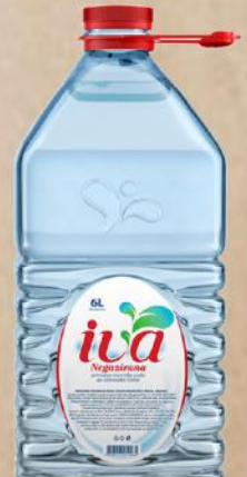
VODA 6L BALON