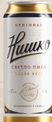
PIVO 0,5L LIMENKA