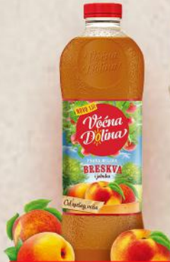
SOK 1,5L BRESKVA