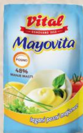
MAJONEZ LIGHT 90G