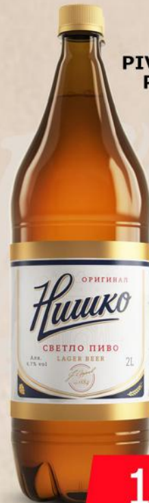
PIVO 2L PVC