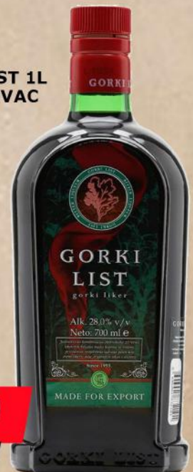
GORKI LIST 1L PELINKOVAC