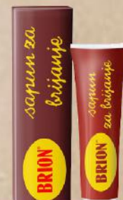
AL BRION PASTA ZA BRIJANJE 75ML