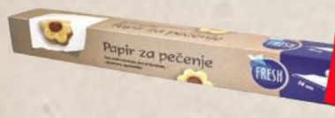
PAPIR ZA PEČENJE 38/20M