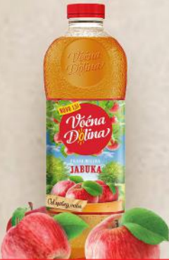
SOK 1,5L JABUKA