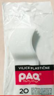
VILJUŠKA PLASTIČNA BELA 20/1