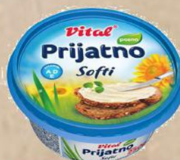
PRIJATNO SOFTI 250G