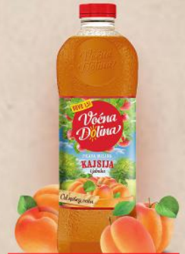
SOK 1,5L KAJSIJA