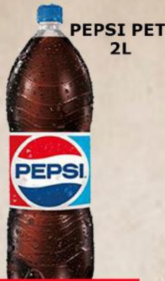
PEPSI PET 2L