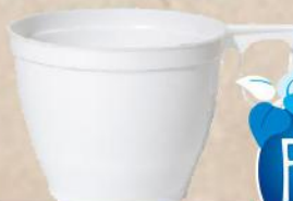
SOLJICA PLASTCNA 0,18L 10/1