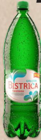
VODA GOLIJSKA BISTRICA 2L