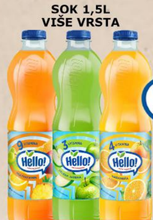
SOK 1,5L VIŠE VRSTA