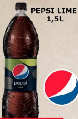
PEPSI LIME 1,5L