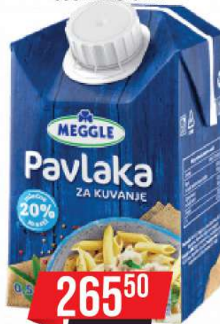
PAVLAKA ZA KUVANJE 500ML 20%MM