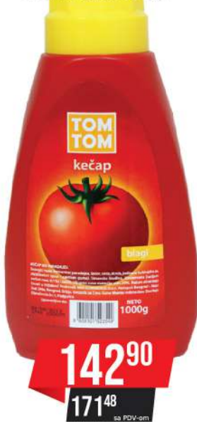
TOM TOM KEČAP BLAGI 1000G