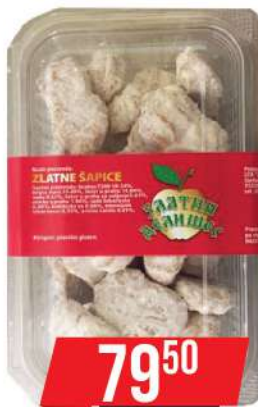
ZD ZLATNA ŠAPIČA 250G