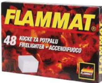
KOCKA ZA POTPALU FLAMMAT 48/1