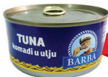
BARBA TUNA KOMADI 170G U ULJU