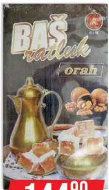
BAŠ RATLUK 400G ORAH