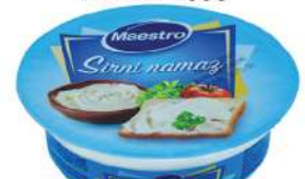
MAESTRO SIRNI NAMAZ 100G