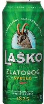
LAŠKO PIVO 0,5L