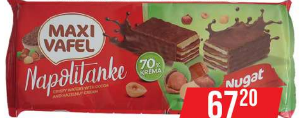
MAXI VAFEL NUGAT 140G NAPOLITANKE