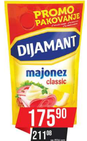
MAJONEZ 540ML CLASSIC