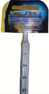
BIC FLEX 3 BRIJAČ 1/1