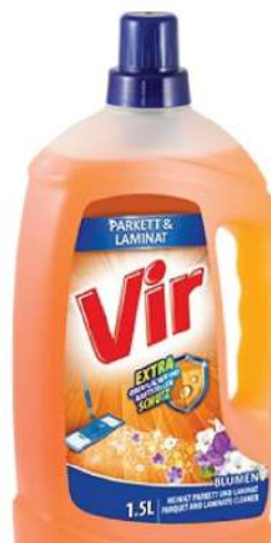
VIR TEČNOST ZA PARKET 1500ML