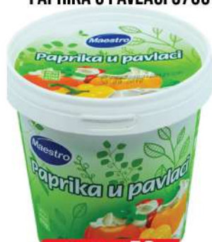
MAESTRO PAPRIKA U PAVLACI 670G