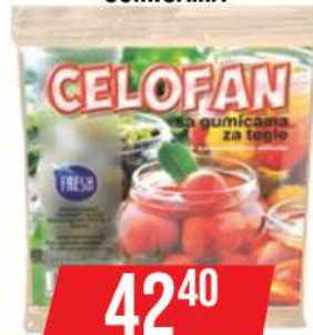
CELOFAN SA GUMICAMA