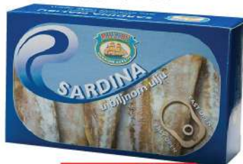
MS MALIBU SARDINA U ULJU 125G