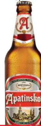
APATINSKO PIVO 0,5L