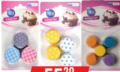
PAPIRNA KORPICA 45/65/70