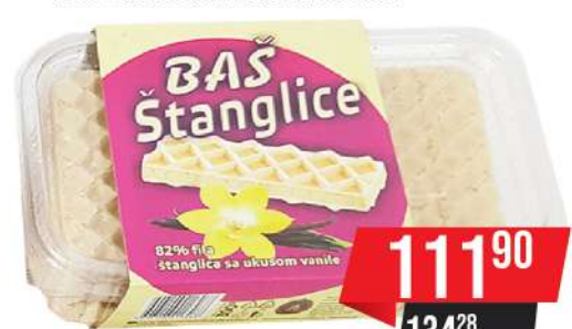
BAŠ ŠTANGLICE VANILA 300GR