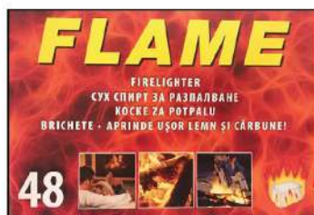
KOCKA ZA POTPALU FLAME 48/1