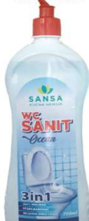
SANSA WC SANIT OKEAN 750ML