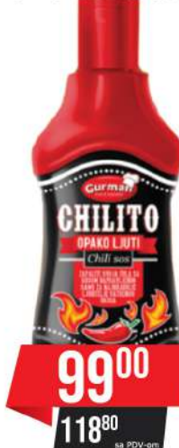
GURMAN CHILITO OPAKO LJUTI CHILI SOS 250G