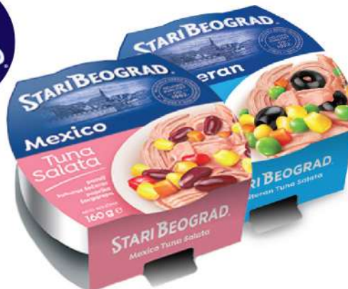
TGK SALATA 160G VIŠE VRSTA