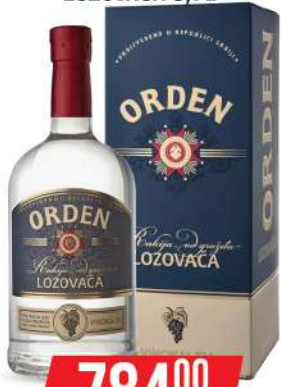
KALEM ORDEN LOZOVAČA 0,7L