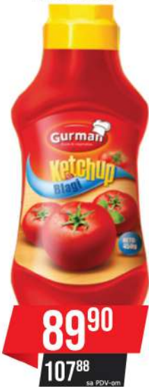
GURMAN KEČAP BLAGI 450G