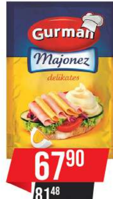
GURMAN MAJONEZ DELIKATES 180ML