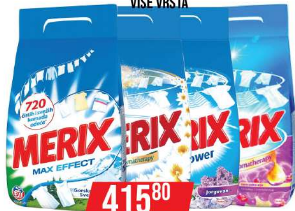
MERIX DETERDŽENT ZA VEŠ 3KG VIŠE VRSTA