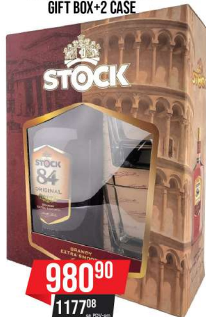
STOCK 84 VSOP BRANDY GIFT BOX+2 ČAŠE