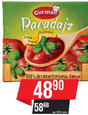
PASIRANI PARADAJZ 500ML BOSILJAK&ORIGANO