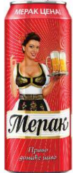
MERAK PIVO 0,5L