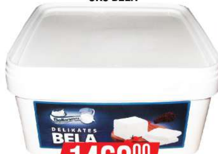
DELIKATES SIR 5KG BELA