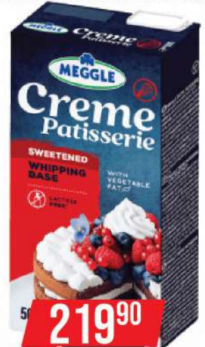
CREME PATISSERIE SLATKA PAVLAKA 500ML 25%MM