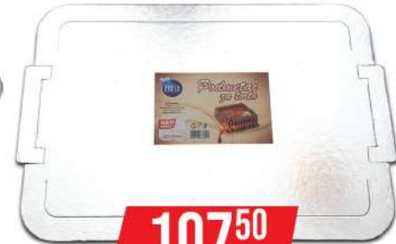
FRESH PODMETAČ ZA TORTU 395X290CM