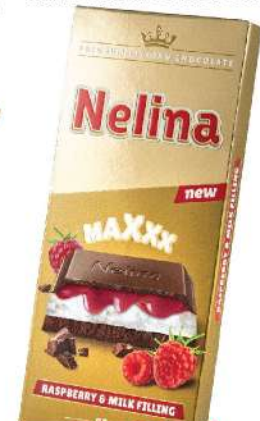
NELINA PREMIUM MAXXX MILK & RASPBERRY 85G