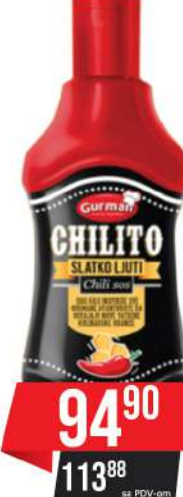
GURMAN CHILITO SLATKO LJUTI CHILI SOS 250G