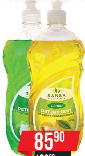
SANSA DETERDŽENT ZA SUDOVE 1L LIMUN/JABUKA