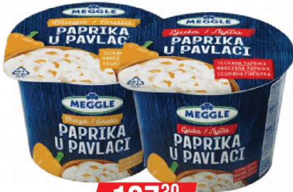
PAPRIKA U PAVLACI 230G BLAGA/LJUTA