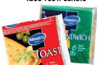
MAESTRO SIR U LISTIĆIMA 120G TOST/SENDIČ