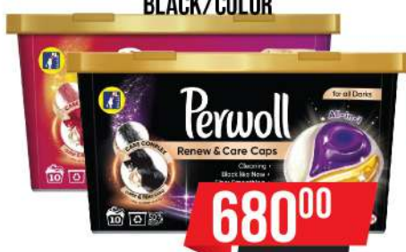
PERWOLL KAPSULE RENEW 27/1 BLACK/COLOR