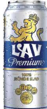
LAV PREMIUM PIVO 0,5L