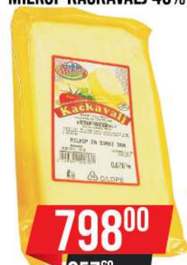
MILKOP KAČKAVALJ 45%