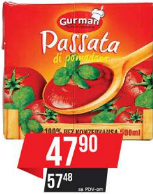
GURMAN PASIRANI PARADAJZ 500ML