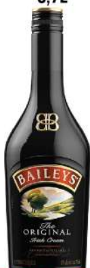
BAILEYS ORIGINAL 0,7L