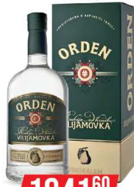
KALEM ORDEN VILJAMOVKA 0,7L