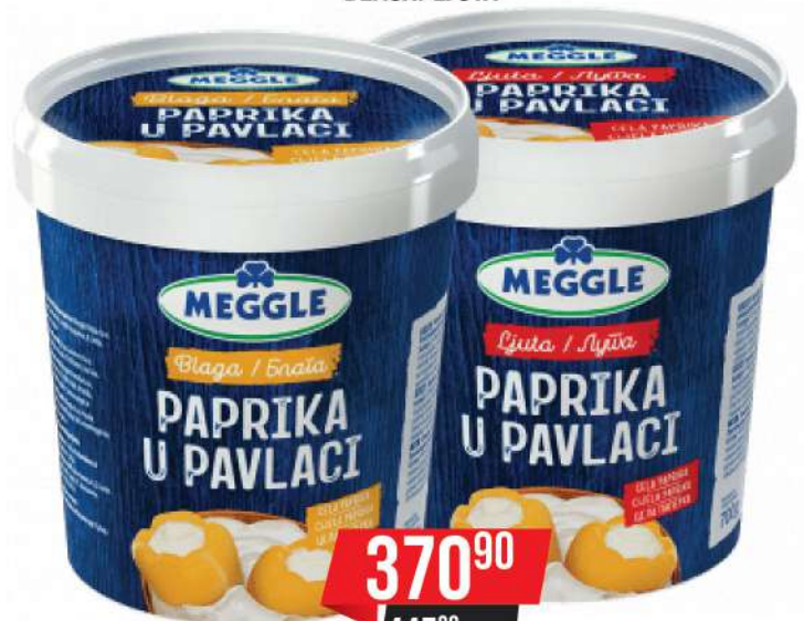
PAPRIKA U PAVLACI 700G BLAGA/LJUTA