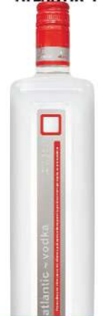
RUBIN VODKA ATLANTIK 1L