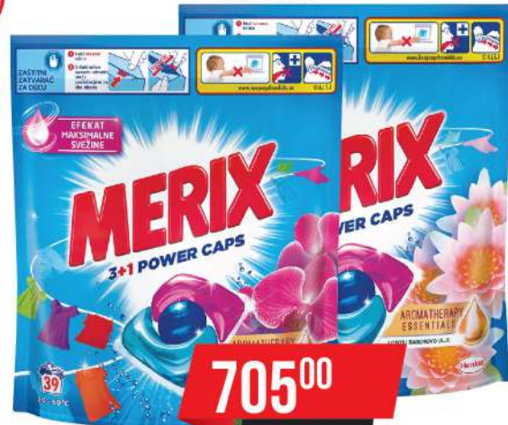
MERIX CAPS 39/1 VIŠE VRSTA