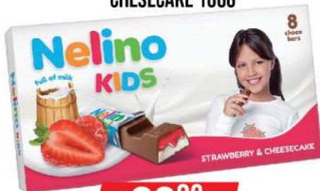
NELINO KIDS STRAWBERRY CHEESECAKE 100G