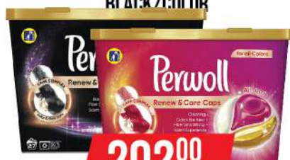
PERWOLL KAPSULE RENEW 10/1 BLACK/COLOR