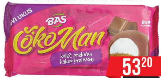
BAŠ ČOKOMAN 112G PENASTI KOLAČ