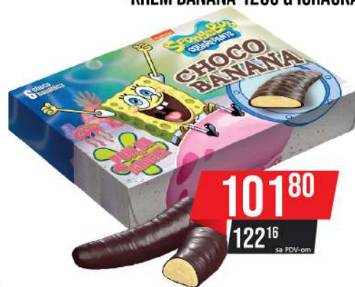
NELLY SPONGE BOB KREM BANANA 120G & IGRAČKA