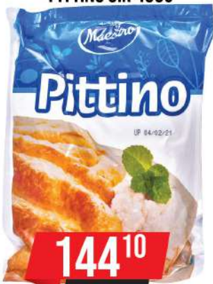
MAESTRO PITTINO SIR 450G