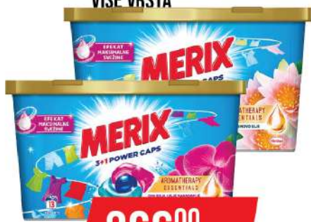
MERIX CAPS 13/1 VIŠE VRSTA