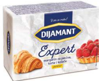
MARGARIN EXPERT 250G