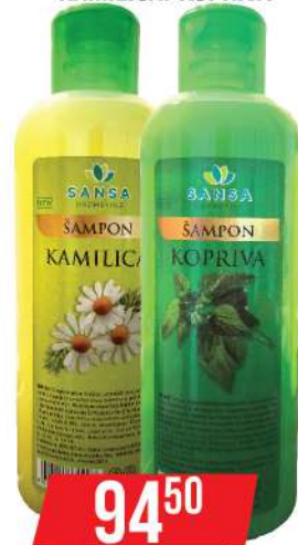
SANSA ŠAMPON ZA KOSU 1L KAMILICA/KOPRIVA