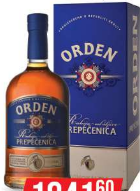
KALEM ORDEN PREPEČENICA 0,7L