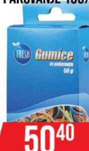
GUMICE ZA PAKOVANJE 100/1