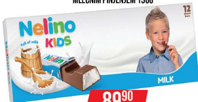
NELINO KIDS ČOKOLADA SA MLEČNIM PINJENJEM 150G