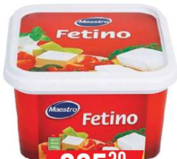
MAESTRO FETINO 450G