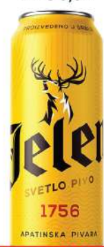
JELEN PIVO 0,5L