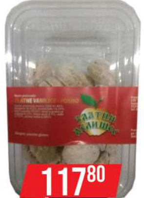
ZD ZLATNA VANILIČA 250G