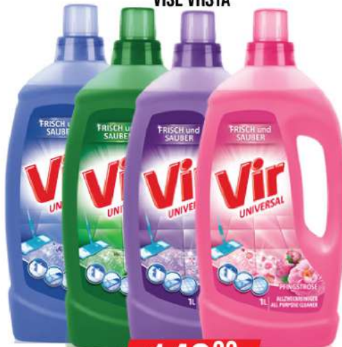
VIR TEČNOST ZA POD 1000ML VIŠE VRSTA