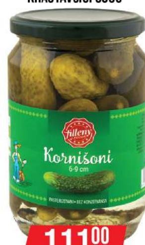
LOV KRSTAVČIĆI 680G