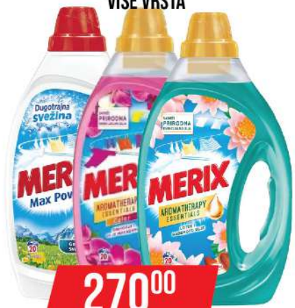
MERIX GEL 1L VIŠE VRSTA