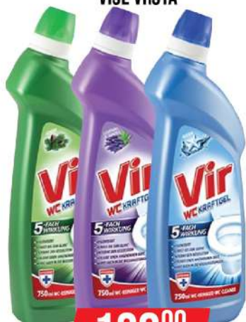
VIR WC GEL 750ML VIŠE VRSTA