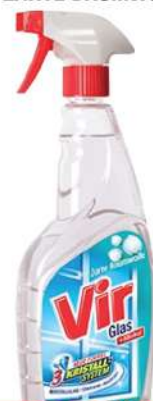
VIR GLASS 750ML ZARTE BAUMWOLLE