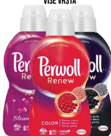
PERWOLL 960ML VIŠE VRSTA