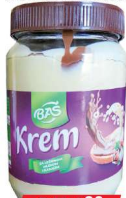
BAŠ KREM MLEČNI 800G