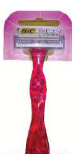
BIC MISS SOLEIL BRIJAČ 1/1