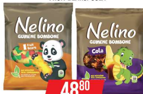
NELLY GUMENE BOMBONE 90G FRUIT BEARS/COLA