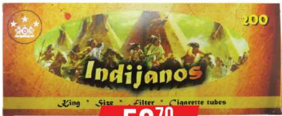
FILTRI INDIANOS 200KOM