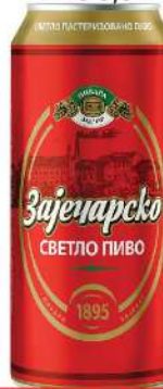
ZAJEČARSKO PIVO 0,5L