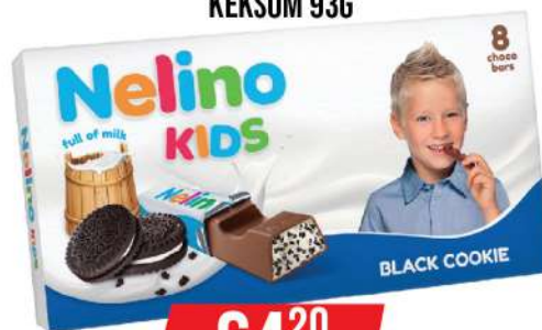
NELINO KIDS SA CRNIM KEKSOM 93G