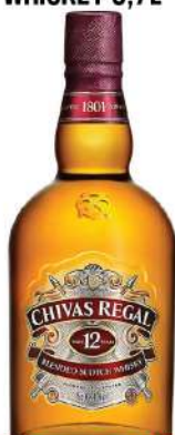
CHIVAS REGAL 12 WHISKEY 0,7L