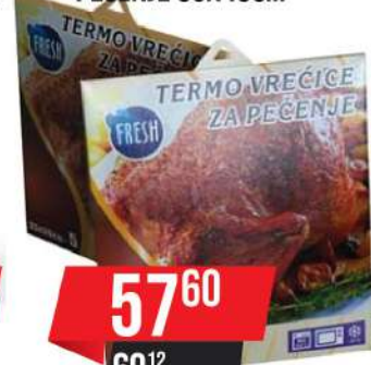
TERMO VREĆICE ZA PEČENJE 35X43CM