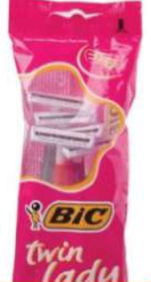
BIC TWIN LADY HC 24