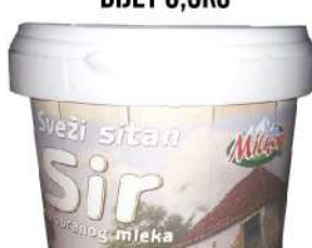
MILKOP SITAN SIR DIJET 0,5KG