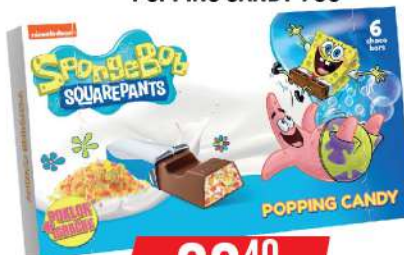
NELLY SPONGEBOB & KIDS POPPING CANDY 75G