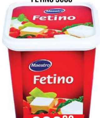
MAESTRO FETINO 900G