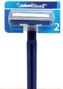
GILLETTE II FIXED HRDC