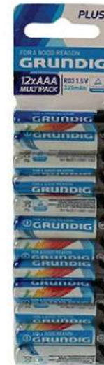
GRUNDIG BATERIJE AAA 12/1 BLISTER