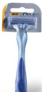
BIC FLEX COMFORT 3 BRIJAČ 1/1