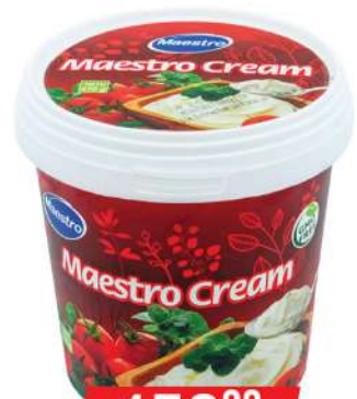
MAESTRO CREAM 670G