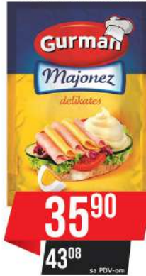
GURMAN MAJONEZ DELIKATES 90ML