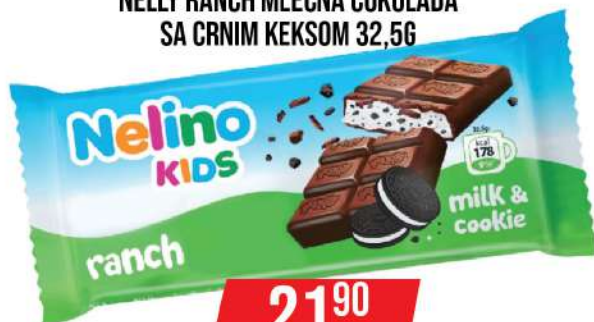
NELLY RANCH MLEČNA ČOKOLADA SA CRNIM KEKSOM 32,5G