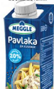
PAVLAKA ZA KUVANJE 200ML 20%MM