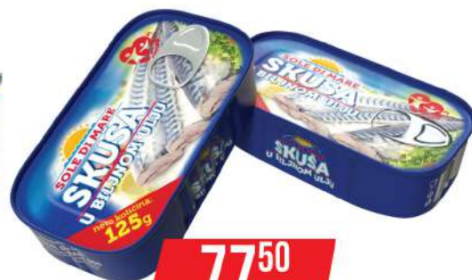
SOLE DI MARE SKUŠA 125G