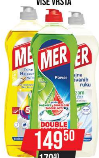
MER 750ML VIŠE VRSTA