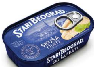
TGK SKUŠA FILETI 100G