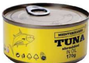
MS TUNJEVINA MEDITERANEO 170G-SITNA