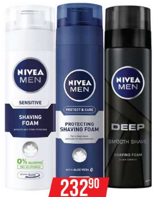
NIVEA SHAVING FOAM 200ML VIŠE VRSTA