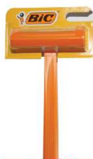
BIC SENSITIVE 1 BRIJAČ 1/1 HC