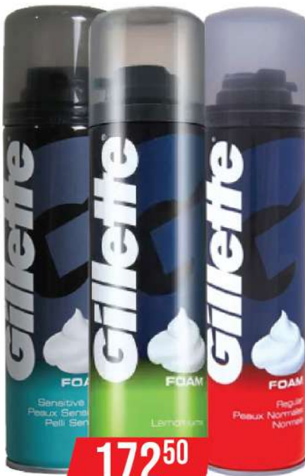
GILLETTE SHAVING FOAM 200ML VIŠE VRSTA