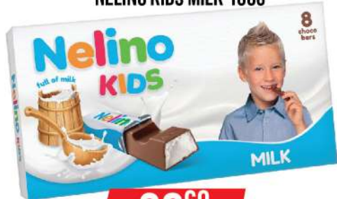
NELINO KIDS MILK 100G