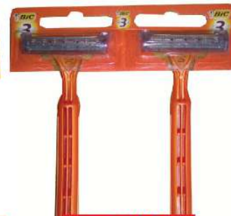
BIC SENSITIVE3 BRIJAČ 1/1 HC