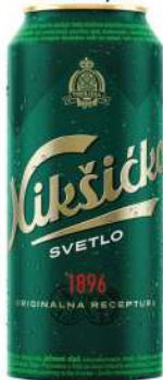
NIKŠIČKO PIVO 0,5L