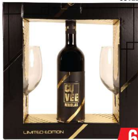
NIKOLAS WINES PREMIUM VINO 0,75L + 2 ČAŠE CUVEE/TAMJANIKA