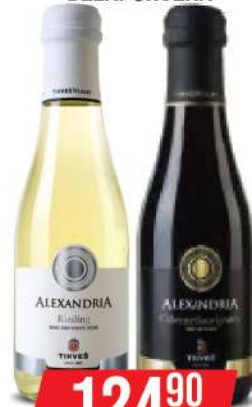
ALEKSANDRIA VINO 0,187L BELA/CRVENA