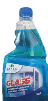
SANSA GLASS 750ML BEZ PUMPICE