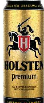
HOLSTEN PIVO 0,5L