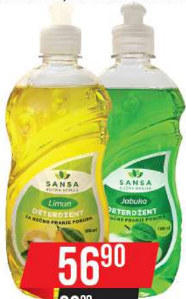
SANSA DETERDŽENT ZA SUDOVE 0,5L LIMUN/JABUKA