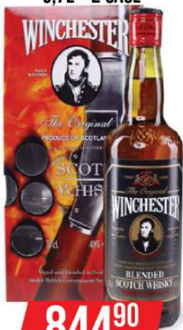
WHISKY WINCHESTER 0,7L + 2 ČAŠE