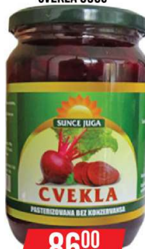
SUNCE JUGA CVEKLA 690G