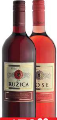
KALEM VINO 1L RUŽICA/ROSE