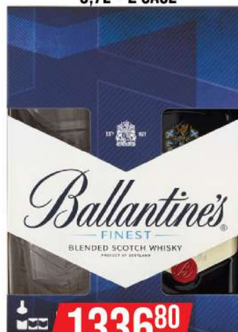
BALLANTINES FINEST 0,7L + 2 ČAŠE