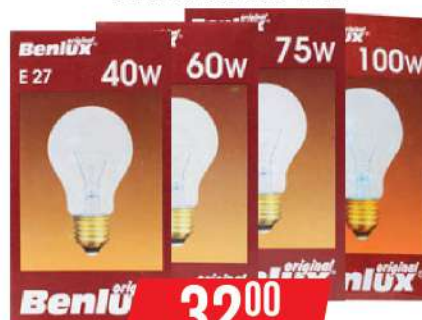
BENLUX SIJALICA E-27 40W/60W/75W/100W