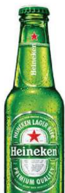
HEINEKEN PIVO 0,25L