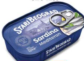
SARDINA U BILJNOM ULJU 125G