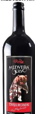
RUBIN VINO 1L MEDVEĐA KRV