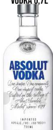
ABSOLUT VODKA 0,7L