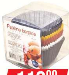
PAPIRNA KORPICA 100/1