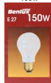
BENLUX SIJALICA E-27 150W BENLUX SIJALICA E-14 40W/60W