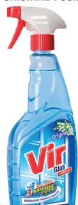
VIR GLASS ORIGINAL 750ML