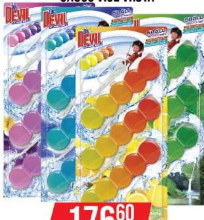
DR DEVIL WC KUGLICE 3X35G VIŠE VRSTA