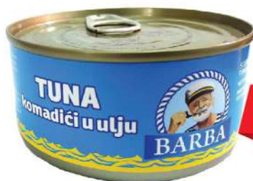
BARBA TUNA KOMADIĆI 170G U ULJU