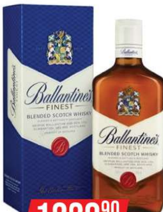
BALLANTINES FINEST 0,7L