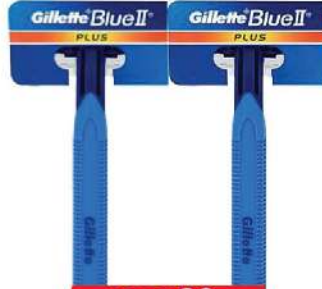
GILLETTE BLUE II PLUS ULTRAGRIP HRDC-2 KOMADA U PAKOVANJU