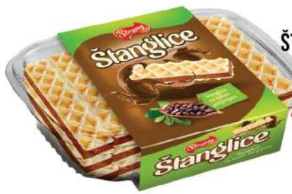
STRONG ŠTANGLICE KAKAO 300G