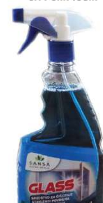
SANSA GLASS 750ML SA PUMPICOM