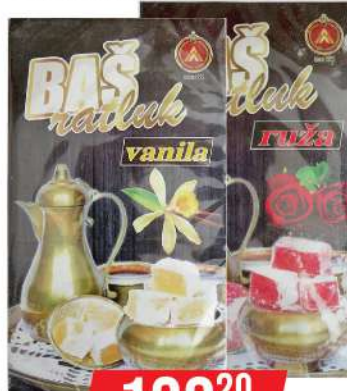
BAŠ RATLUK 400G VANILA/RUŽA