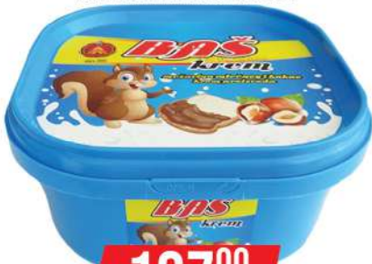
BAŠ KREM MLEČNI 500G