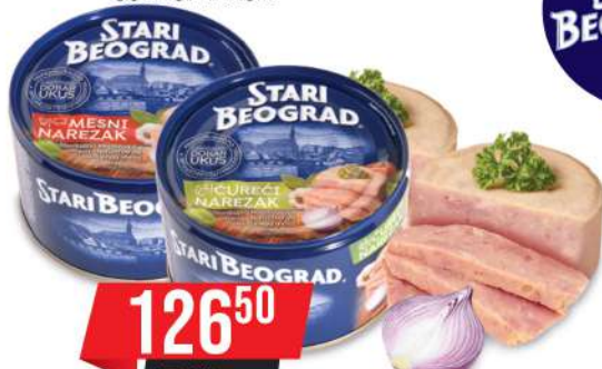
TGK NAREZAK 400G ČUREČI/MESNI