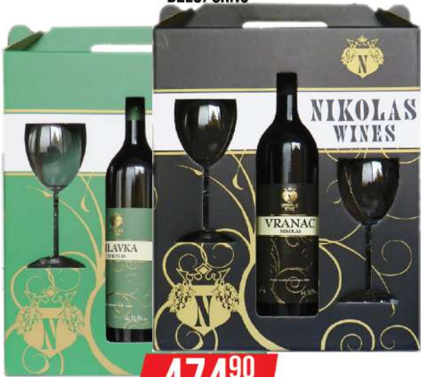
NIKOLAS WINES VINO 0,75L + 2 ČAŠE BELO/CRNO