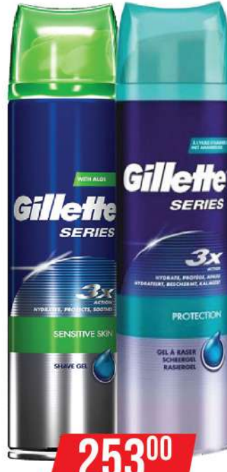
GILLETTE SHAVING GEL 200ML VIŠE VRSTA