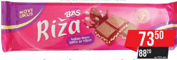
BAŠ ČOKOLADA RIŽA 150G