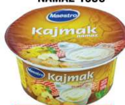
MAESTRO KAJMAK NAMAZ 150G