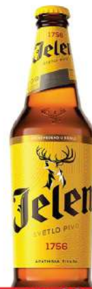
JELEN PIVO 0,5L