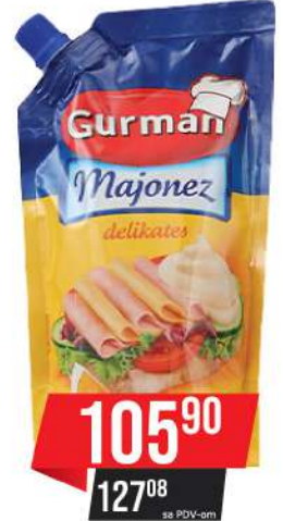
GURMAN MAJONEZ DELIKATES 285ML