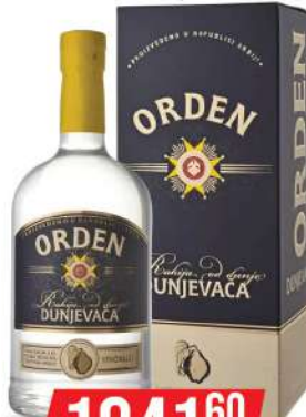
KALEM ORDEN DUNJA 0,7L