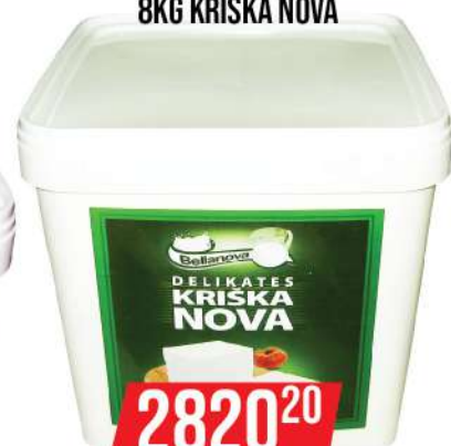
DELIKATES SIR 8KG KRIŠKA NOVA