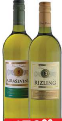
KALEM VINO 1L GRAŠEVINA/RIZLING