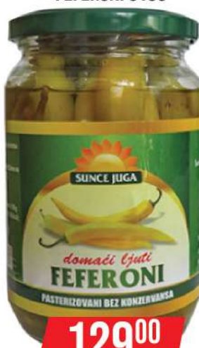
SUNCE JUGA FEFERONI 610G