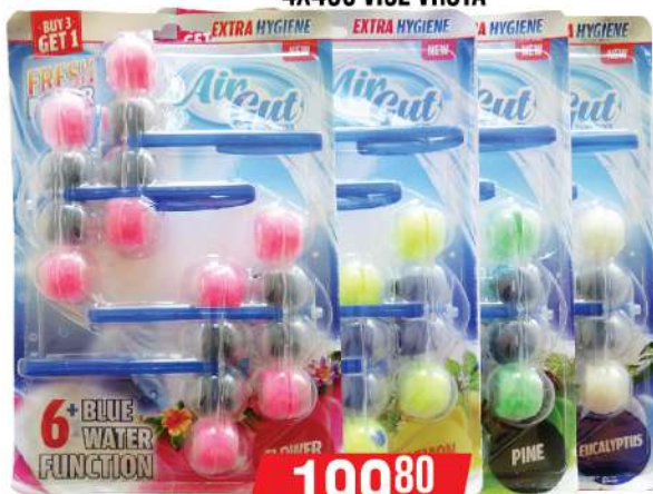
MISS FLORA WC KUGLICE 4X40G VIŠE VRSTA