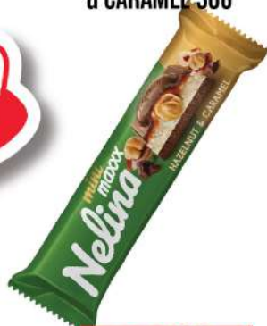
NELINA PREMIUM MINI MAXXX HAZELNUT & CARAMEL 36G