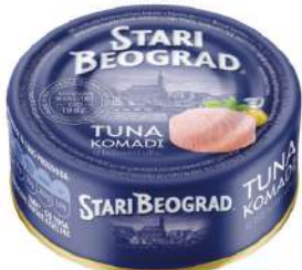
TGK TUNA 160G KOMADI