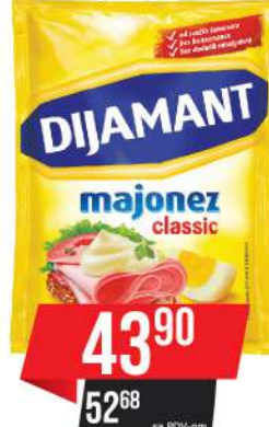
MAJONEZ 95ML CLASSIC