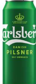
CARLSBERG PIVO 0,5L