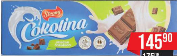
BAŠ STRONG ČOKOLINA 250G MLEČNA ČOKOLADA