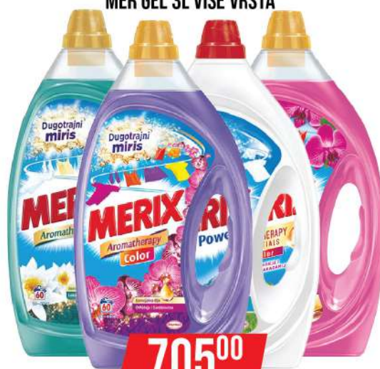
MER GEL 3L VIŠE VRSTA