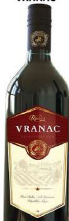
RUBIN VINO 1L VRANAC