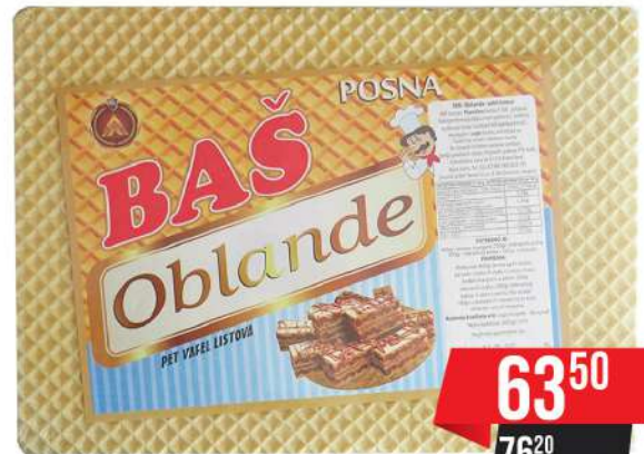
BAŠ OBLANDA 200G