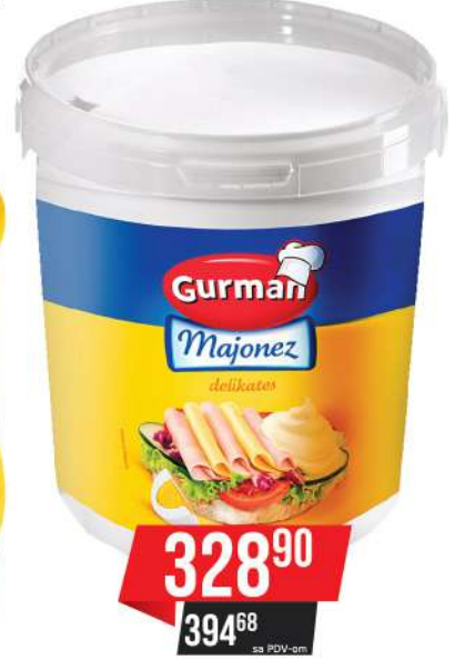
GURMAN MAJONEZ DELIKATES 900ML