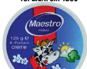
MAESTRO TOPLJENI SIR 125G