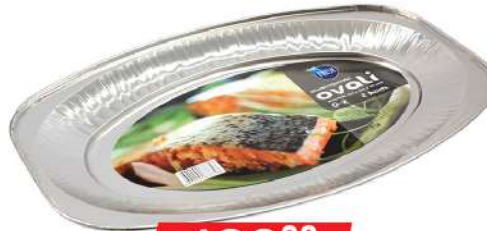
FRESH ALU OVAL 0-2 2/1