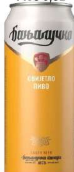
BANJALUČKO PIVO 0,5L