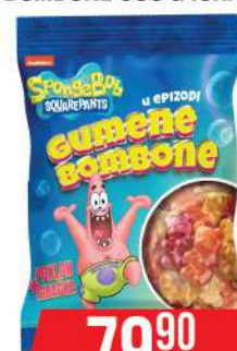
NELLY SPONGE BOB GUMENE BOMBONE 90G & IGRAČKA