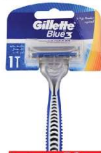
GILLETTE BLUE 3 COMFORT 1/1 BRIJAČ