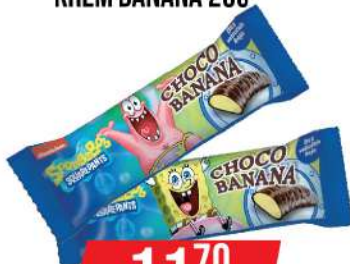
NELLY SPOGNE BOB KREM BANANA 20G