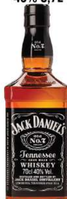
JACK DANIELS 40% 0,7L