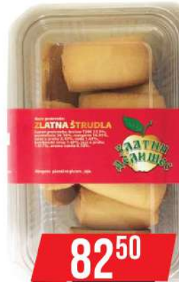
ZD ZLATNA ŠTRUDLA 250G