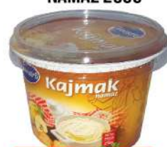
MAESTRO KAJMAK NAMAZ 250G