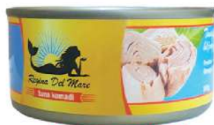
REGINA DELMARE TUNA KOMADI 760G U ULJU