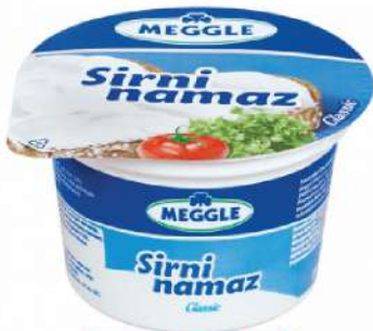
SIRNI NAMAZ 200G CLASSIC