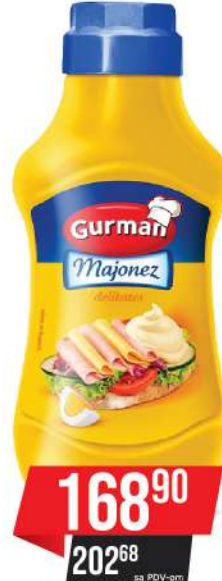
GURMAN MAJONEZ DELIKATES 450ML