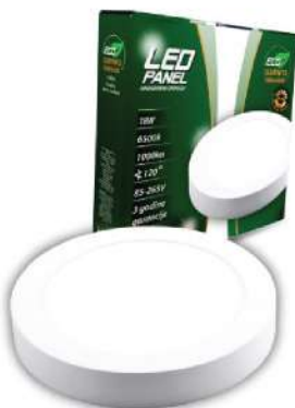
ALFA ECO LUMNPO-18W 6500K OKRUGLI 210MM 1350LM LED PANEL