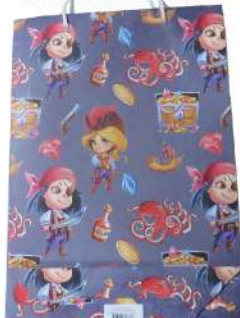
EURO UKRASNE KESE ZA POKLON B2 DEČIJA