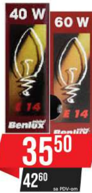
BENLUX SIJALICA E-14 40W/60W