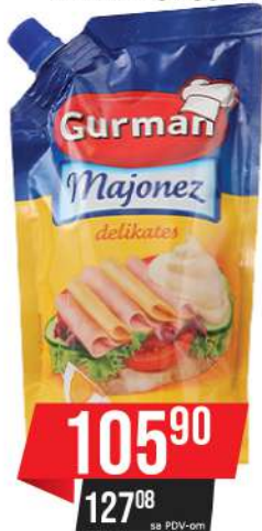
GURMAN MAJONEZ DELIKATES 285ML