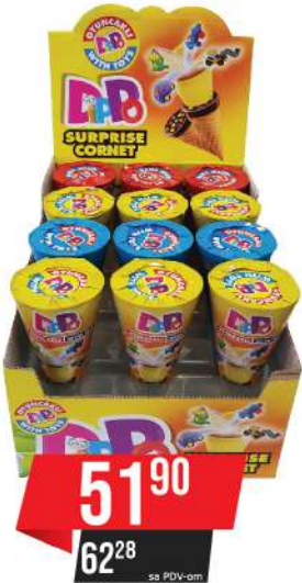
LBD DIPPO 25G FUN ČOKO KORNET&IGRAČKA