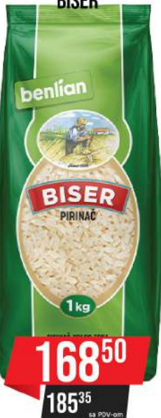
KOZ PIRINAČ 1KG BISER