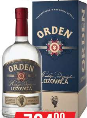
KALEM ORDEN LOZOVAČA 0,7L