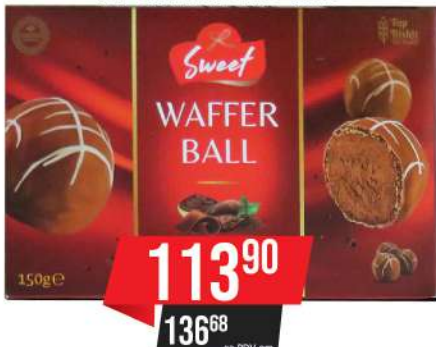
TOP WAFFER BALL 150G