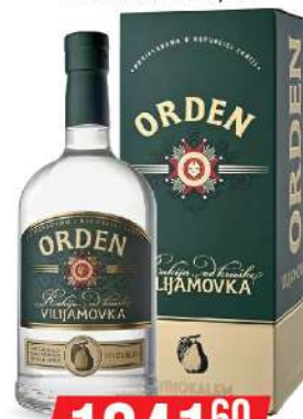
KALEM ORDEN VILJAMOVSKA 0,7L