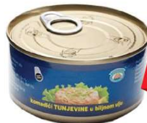
MS MALIBU TUNJEVINA 170G