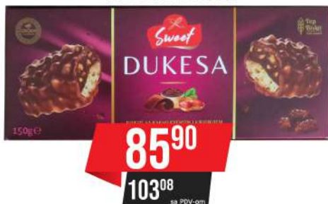
TOP DUKESA 150G