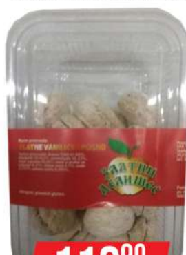
ZD ZLATNA VANILICA 250G