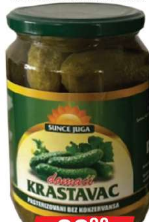
SUNCE JUGA DOMAĆI KRSTAVAC 690G