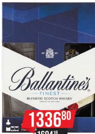
BALLANTINES FINEST 0,7L + 2 ČAŠE

BALLANTINES FINEST 0,7L 1229 90 1475 88 sa PDV-om