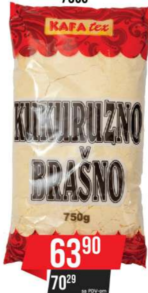
KUKURUZNO BRAŠNO 750G