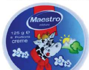
MAESTRO TOPLJENI SIR 125G