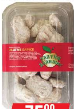
ZD ZLATNA ŠAPICA 250G