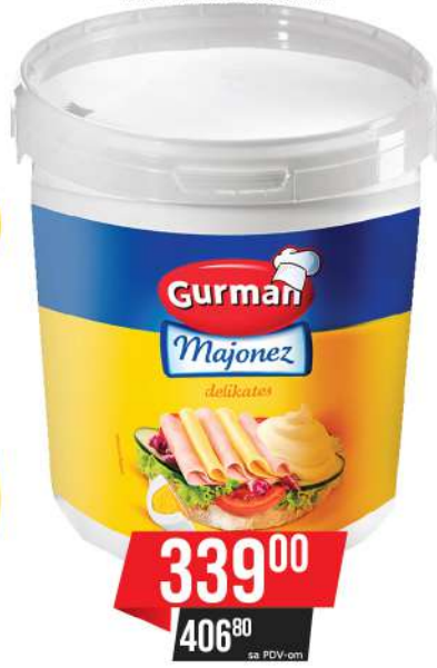
GURMAN MAJONEZ DELIKATES 900ML