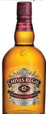
CHIVAS REGAL 12 WHISKEY 0,7L