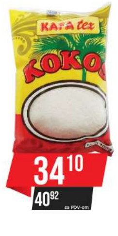
KOKOS BRAŠNO 100G