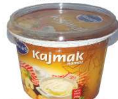
MAESTRO KAJMAK NAMAZ 250G