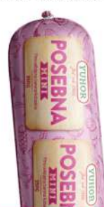
MINI POSEBNA KOBASICA 350G