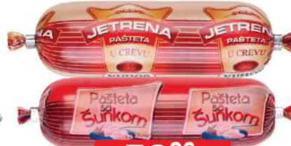
PAŠTETA 130G U CREVU JETRENA/SA ŠUNKOM