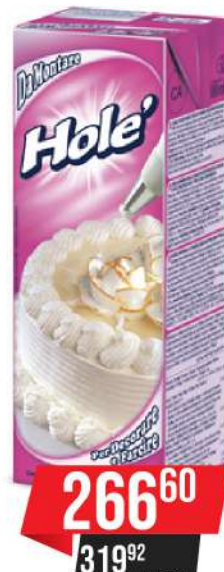
HOLE BILJNA PAVLAKA 1000ML