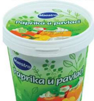
MAESTRO PAPRIKA U PAVLACI 670G