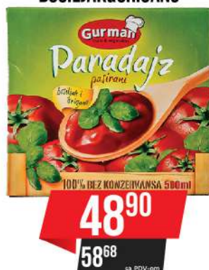
PASIRANI PARADAJZ 500ML BOSILJAK&ORIGANO