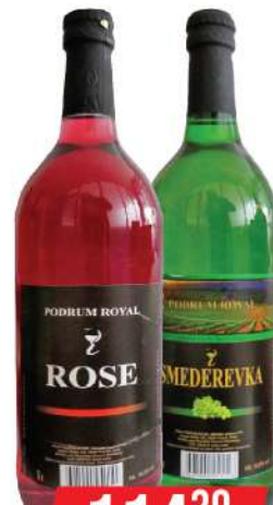
ROJAL VINO 1L ROSE/SMEDEREVKA