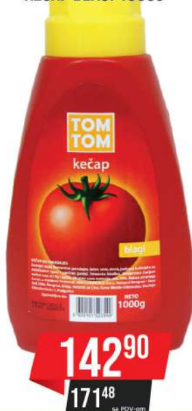
TOM TOM KEČAP BLAGI 1000G