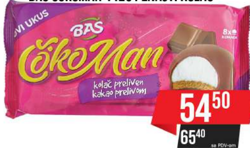
BAŠ ČOKOMAN 112G PENASTI KOLAČ