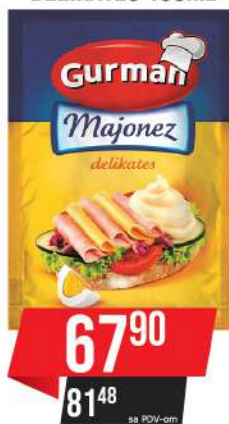
GURMAN MAJONEZ DELIKATES 180ML