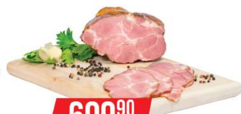
PANT DIMLJENI SVINJSKI VRAT VAKUM