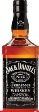
JACK DANIELS 40% 0,7L