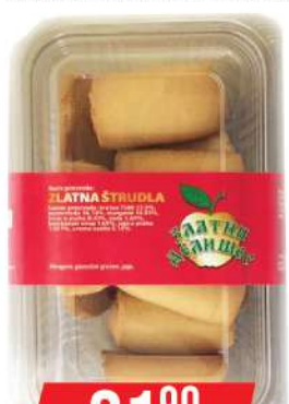
ZD ZLATNA ŠTRUDLA 250G