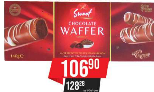
TOP CHOCOLATE WAFER 140G