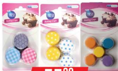
PAPIRNA KORPICA 45/65/70