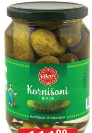
LOV KRSTAVČIĆI 680G