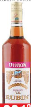
RUBIN VINJAK 1L