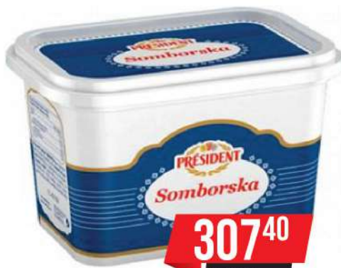
PRESIDENT SOMBORSKA 500G