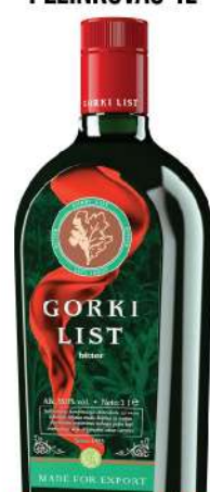
GORKI LIST PELINKOVAC 1L