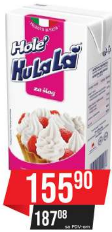
HOLE BILJNA PAVLAKA 500ML