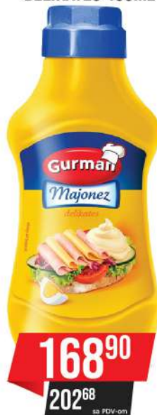
GURMAN MAJONEZ DELIKATES 450ML