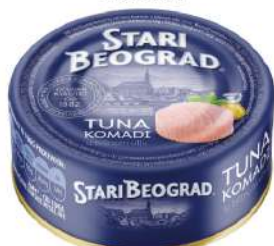
TGK TUNA 160G KOMADI