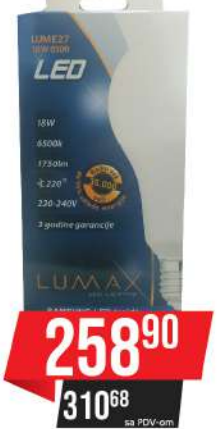
ALFA ECO LUME 27-18W 6500K 1750LM LED SIJALICA