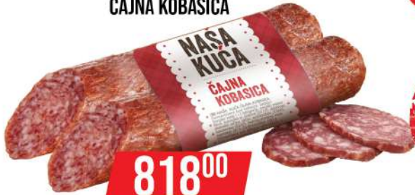
NAŠA KUĆA ČAJNA KOBASICA