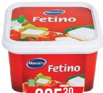
MAESTRO FETINO 450G