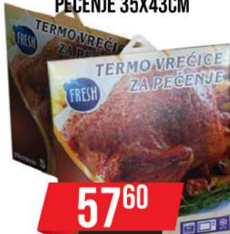
TERMO VREČICE ZA PEČENJE 35X43CM