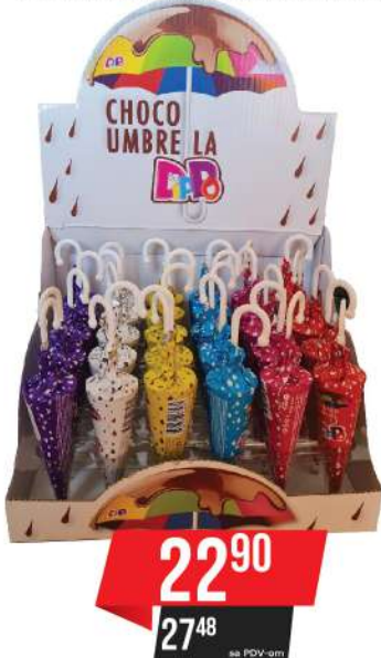
LBD DIPPO CHOCO UMBRELLA 25G