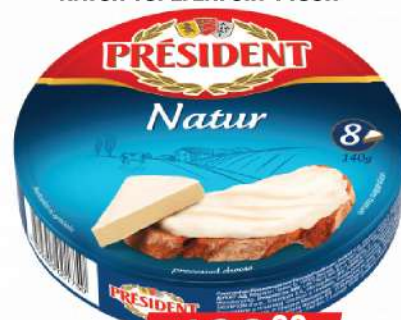
NATUR TOPLJENI SIR 140GR