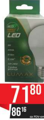
ALFA ECO LUME 27-9W 4000K 810LM LED SIJALICA