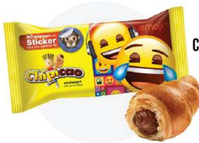
CHIPICAO MIDI 60G-KAKAO

NESCAFÉ CLASSIC 250G 529 00 634 80 sa PDV-om