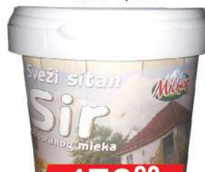
MILKOP SITAN SIR DIJET 0,5KG