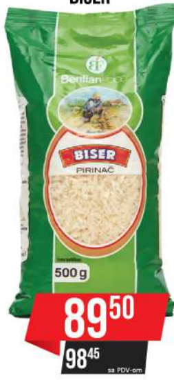
KOZ PIRINAČ 0,5KG BISER