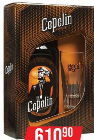
CEPELIN 0,7L + ČAŠA