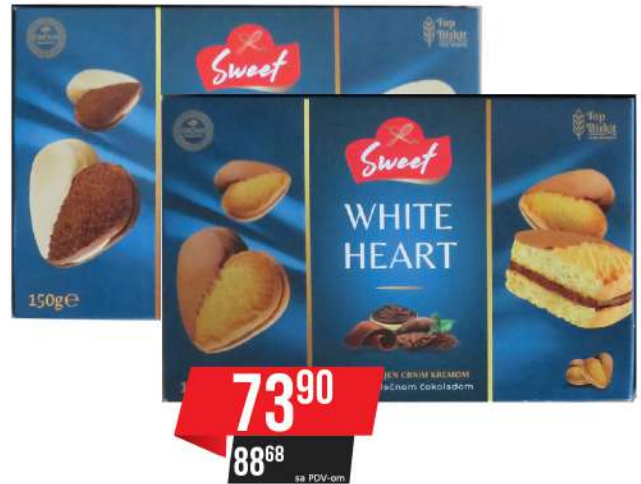
TOP WHITE/BROWN HEART 150G