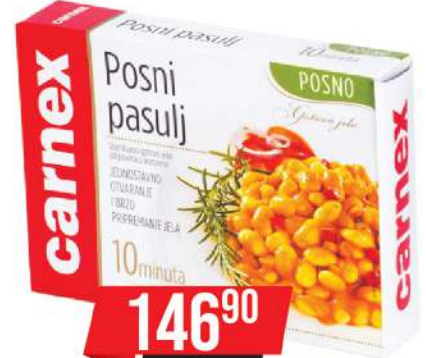
PASULJ POSNI 400G