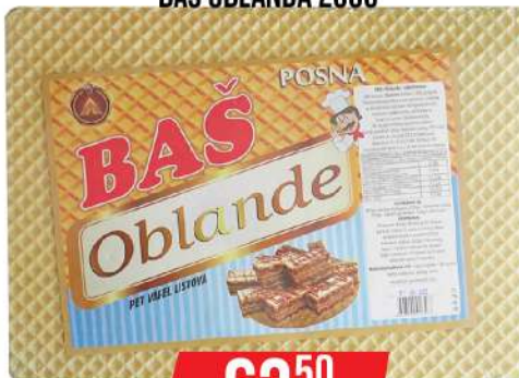
BAŠ OBLANDA 200G