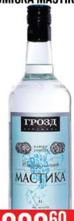
STRUMIČKA MASTIKA 1L