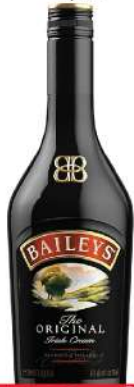
BAILEYS ORIGINAL 0,7L