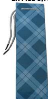
EURO UKRASNE KESE ZA PIĆE 0,7L