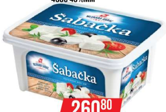
ŠABAČKA PUNOMASNI MEKI SIR 450G 45%MM