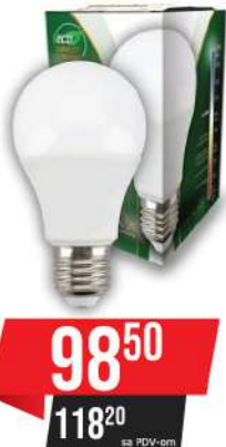
ALFA ECO LUME 27-12W 3000K 1055LM LED SIJALICA