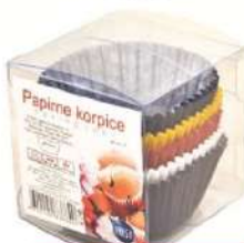
PAPIRNA KORPICA 100/1