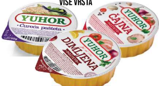
PAŠTETA 50G VIŠE VRSTA