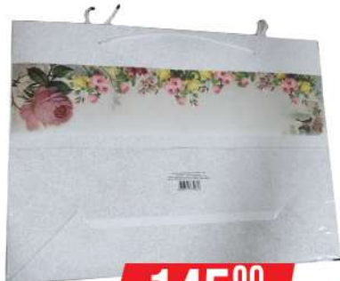
EURO UKRASNE KESE BIG POPREČNA