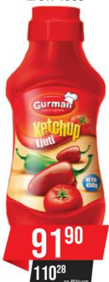
GURMAN KEČAP LJUTI 450G