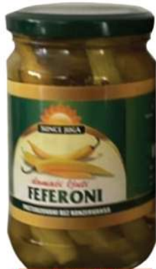
SUNCE JUGA FEFERONI 310G