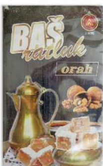
BAŠ RATLUK 400G ORAH