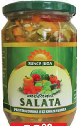
SUNCE JUGA MEŠANA SALATA 670G