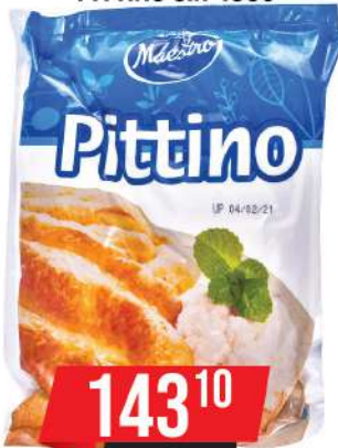
MAESTRO PITTINO SIR 450G