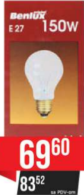
BENLUX SIJALICA E-27 150W