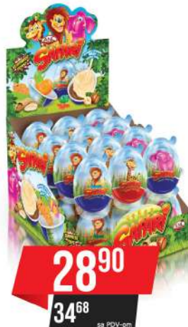
LBD SAFARI JAJE KREM&IGRAČKA 15G