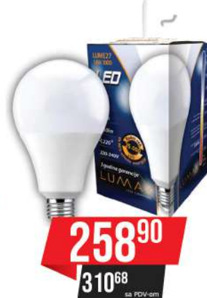
ALFA ECO LUME 27-18W 3000K 1750LM LED SIJALICA