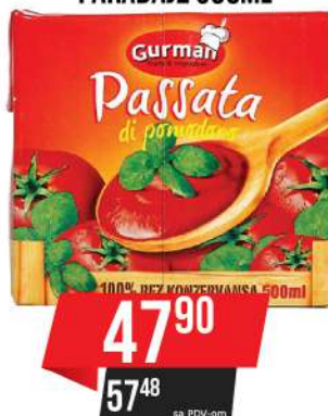
GURMAN PASIRANI PARADAJZ 500ML