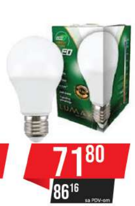
ALFA ECO LUME 27-9W 6500K 810LM LED SIJALICA