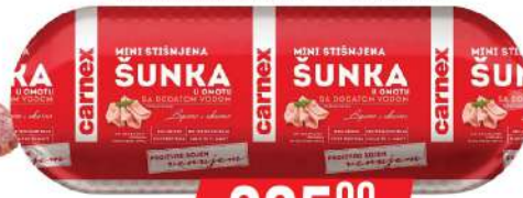
MINI STIŠNJENA ŠUNKA 350G