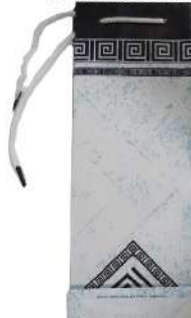
EURO UKRASNE KESE ZA PIĆE 1L