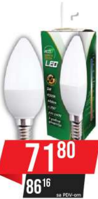
ALFA ECO LUME 27-5W 3000K 400LM LED SIJALICA