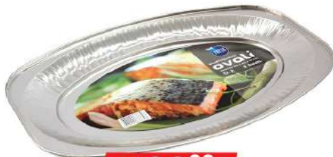
FRESH ALU OVAL 0-2 2/1