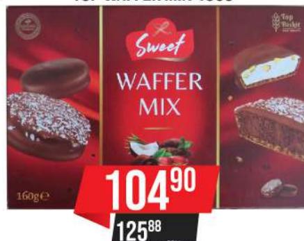
TOP WAFFER MIX 160G