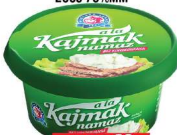
A LA KAJMAK NAMAZ 250G 70%MM