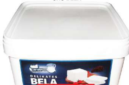
DELIKATES SIR 5KG BELA