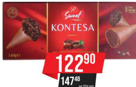
TOP KONTESA 140G