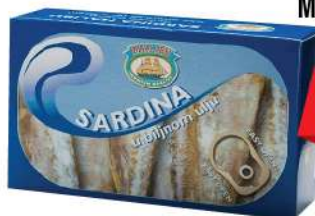
MS MALIBU SARDINA U ULJU 125G