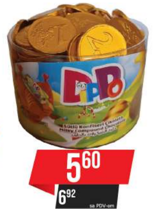
LBD DIPPO CHOCO GOLD COIN 4,5G