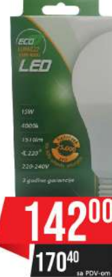
ALFA ECO LUME 27-15W 4000K 1510LM LED SIJALICA