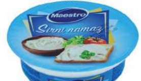
MAESTRO SIRNI NAMAZ 100G