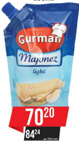
GURMAN MAJONEZ LIGHT 285ML