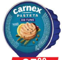
PAŠTETA 75G OD TUNE