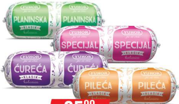
KLASIK KOBASICA 325G VIŠE VRSTA