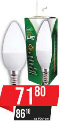
ALFA ECO LUME 27-5W 6500K 400LM LED SIJALICA