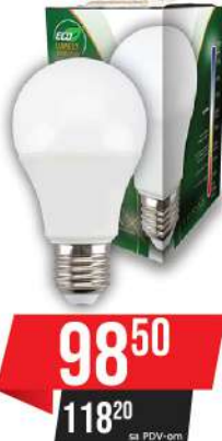
ALFA ECO LUME 27-12W 6500K 1055LM LED SIJALICA