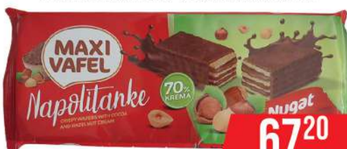
MAXI VAFEL NUGAT 140G NAPOLITANKE