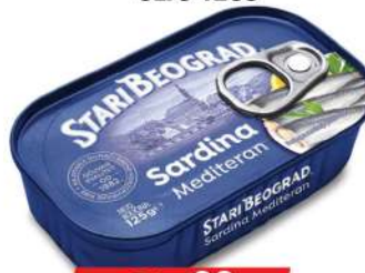
SARDINA U BILJNOM ULJU 125G