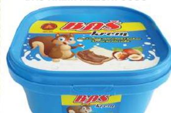
BAŠ KREM MLEČNI 500G