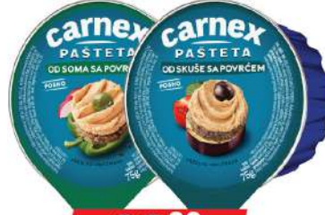
PAŠTETA SA POVRĆEM 75G OD SKUŠE/SOMA