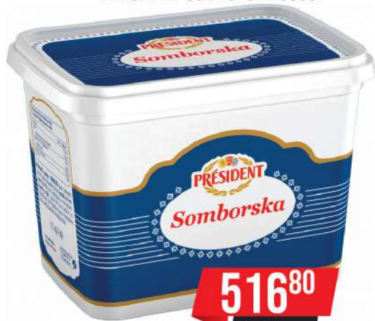
PRESIDENT SOMBORSKA 900G