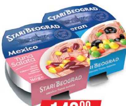
TGK SALATA 160G VIŠE VRSTA