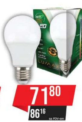
ALFA ECO LUME 27-9W 3000K 810LM LED SIJALICA