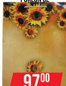
EURO UKRASNE KESE ZA POKLON C2