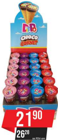
LBD DIPPO 25G ČOKO KORNET