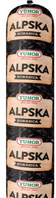
ALPSKA SPECIJAL KOBASICA