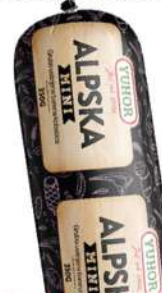
MINI ALPSKA KOBASICA 350G