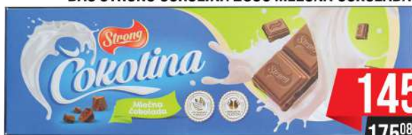
BAŠ STRONG ČOKOLINA 250G MLEČNA ČOKOLADA