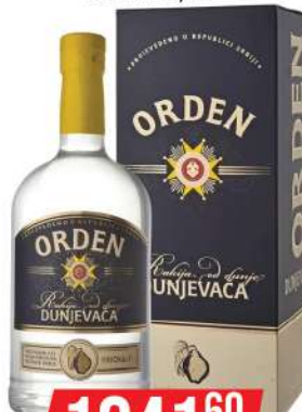
KALEM ORDEN DUNJA 0,7L