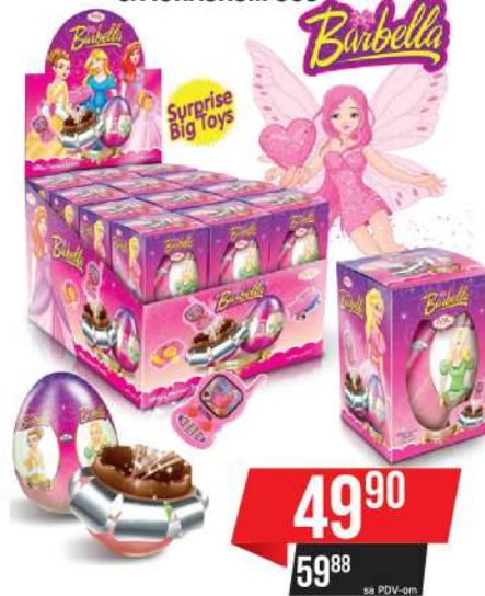
LBD JAJA BARBELLA SA IGRAČKOM 60G