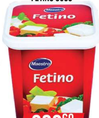
MAESTRO FETINO 900G