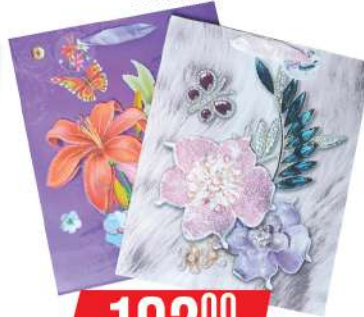
KRON UKRASNE KESE 2830M SREDNJA