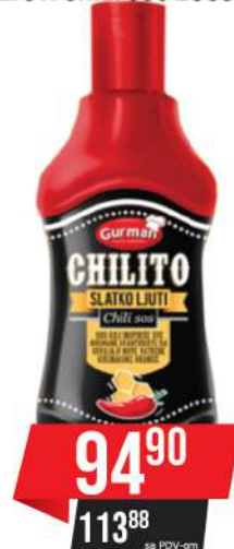
GURMAN CHILITO SLATKO LJUTI CHILI SOS 250G