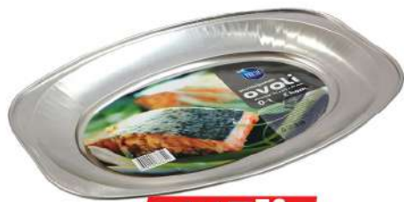
FRESH ALU OVAL 0-12/1