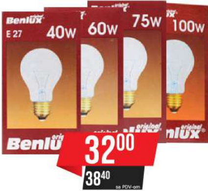
BENLUX SIJALICA E-27 40W/60W/75W/100W