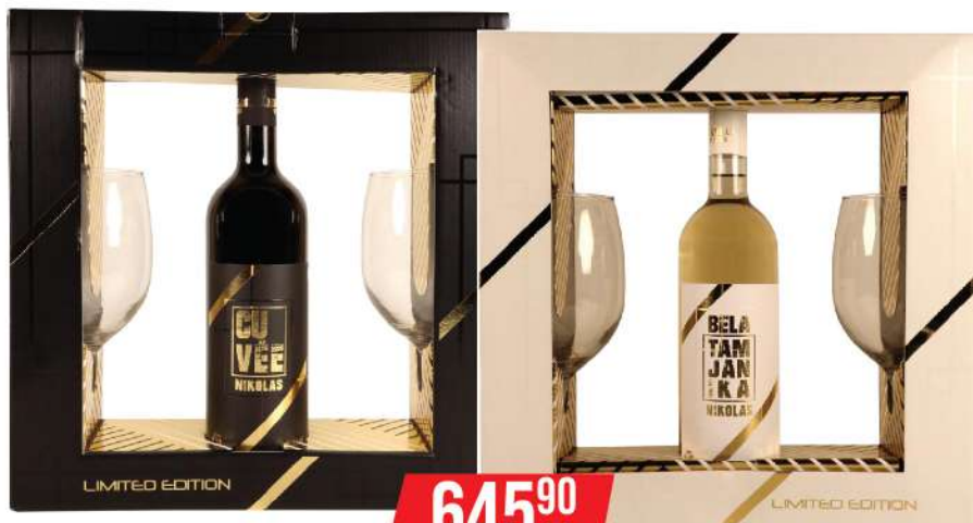
NIKOLAS WINES PREMIUM VINO 0,75L + 2 ČAŠE CUVEE/TAMJANIKA