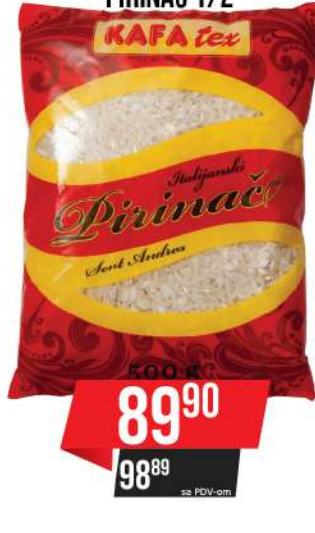
KAFA TEX PIRINAČ 1/2