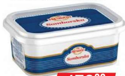
PRESIDENT SOMBORSKA 250G