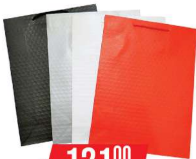
KRON UKRASNE KESE 1005L VELIKA JEDNOBOJNA