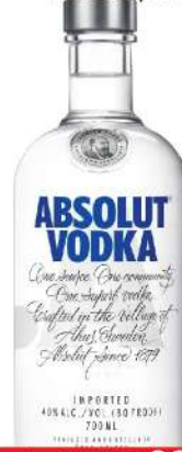
ABSOLUT VODKA 0,7L