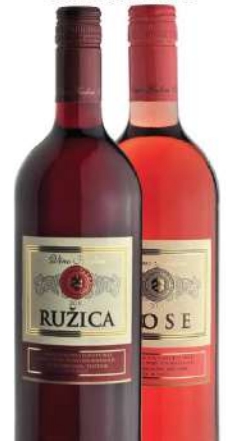
KALEM VINO 1L RUŽICA/ROSE