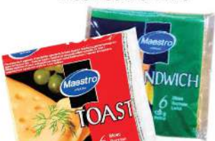
MAESTRO SIR U LISTIĆIMA 120G TOST/SENDIĆ