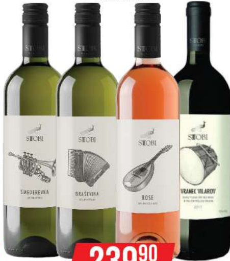
STOBI VINO 1L VIŠE VRSTA