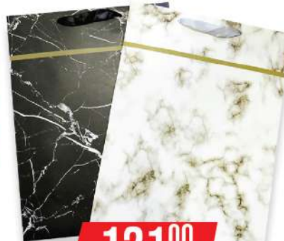
KRON UKRASNE KESE 2805L VELIKA