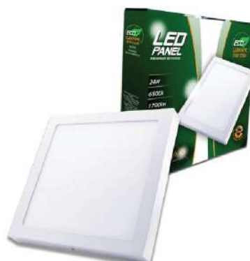
ALFA ECO LUMNPK-18W 6500K CETVRTASTI 210X210MM 1350LM LED PANEL