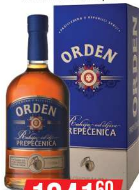
KALEM ORDEN PREPEČENICA 0,7L