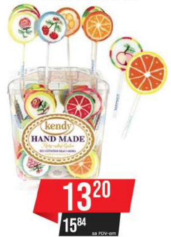
KENDY LIZALICA 8G