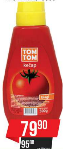
TOM TOM KEČAP BLAGI 500G