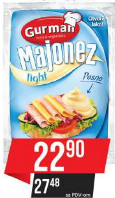
GURMAN MAJONEZ LIGHT 90ML