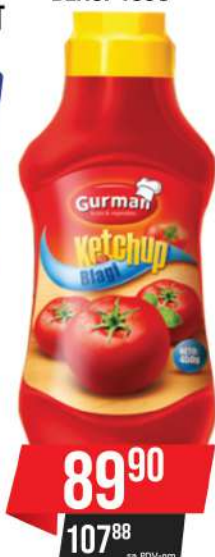
GURMAN KEČAP BLAGI 450G