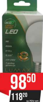
ALFA ECO LUME 27-12W 3000K 1100LM LED SIJALICA