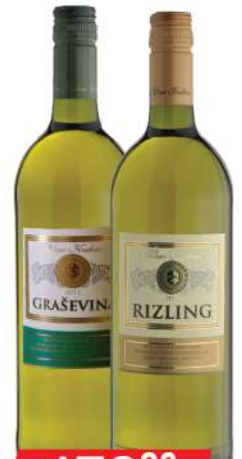
KALEM VINO 1L GRAŠEVINA/RIZLING