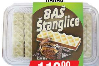
BAŠ ŠTANGLICE 300G KAKAO