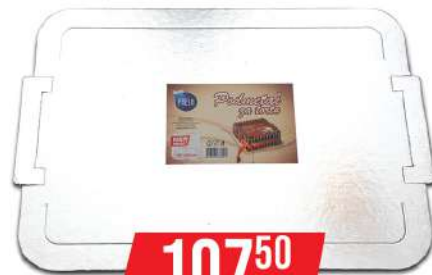
FRESH PODMETAČ ZA TORTU 395X290CM