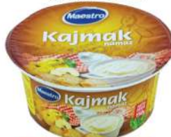
MAESTRO KAJMAK NAMAZ 150G