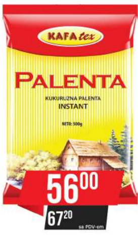
KUKURUZNA PALENTA 500G