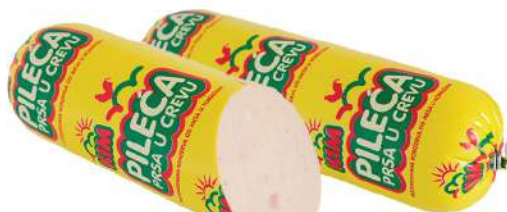
PANT KIM PILEĆA PRSA U CREVU RNF