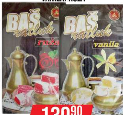
BAŠ RATLUK 400G VANILA/RUŽA