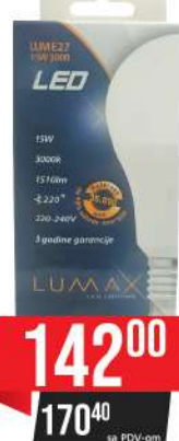
ALFA ECO LUME 27-15W 3000K 1510LM LED SIJALICA