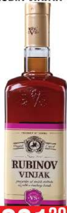
RUBIN VINJAK 1L