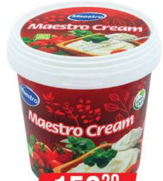
MAESTRO CREAM 670G