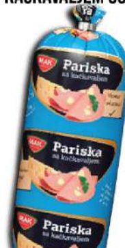
MINI PARIŠKA SA KAČKAVALIEM 350G