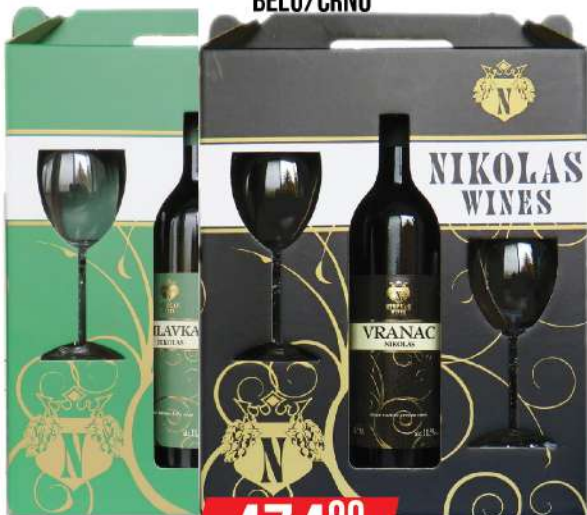
NIKOLAS WINES VINO 0,75L + 2 ČAŠE BELO/CRNO