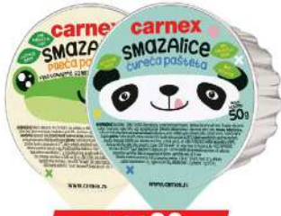
PAŠTETA 50G PILEĆA/ČUREĆA