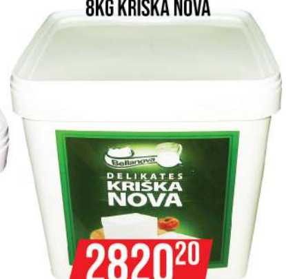
DELIKATES SIR 8KG KRIŠKA NOVA