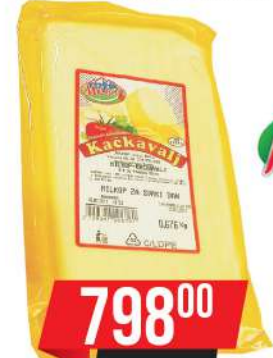
MILKOP KAČKAVALJ 45%