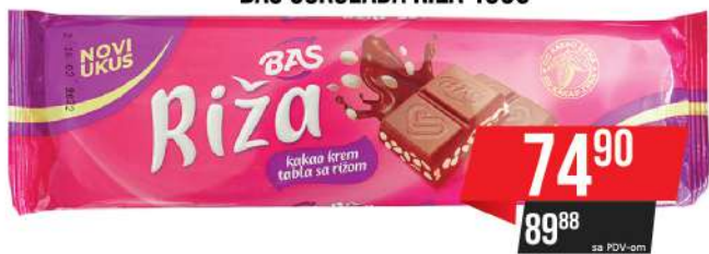
BAŠ ČOKOLADA RIŽA 150G