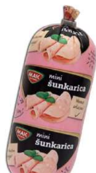
MINI ŠUNKARICA 350G