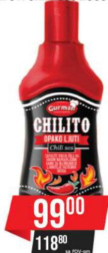
GURMAN CHILITO OPAKO LJUTI CHILI SOS 250G