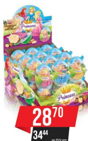
LBD PRINCESS JAJE KREM&IGRAČKA 15G