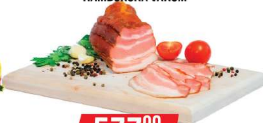
PANT DIMLJENA SLANINA HAMBURŠKA VAKUM