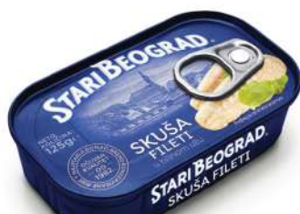
TGK SKUŠA FILETI 100G