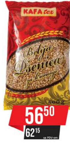
PŠENICA BELIJA 1/2 KG